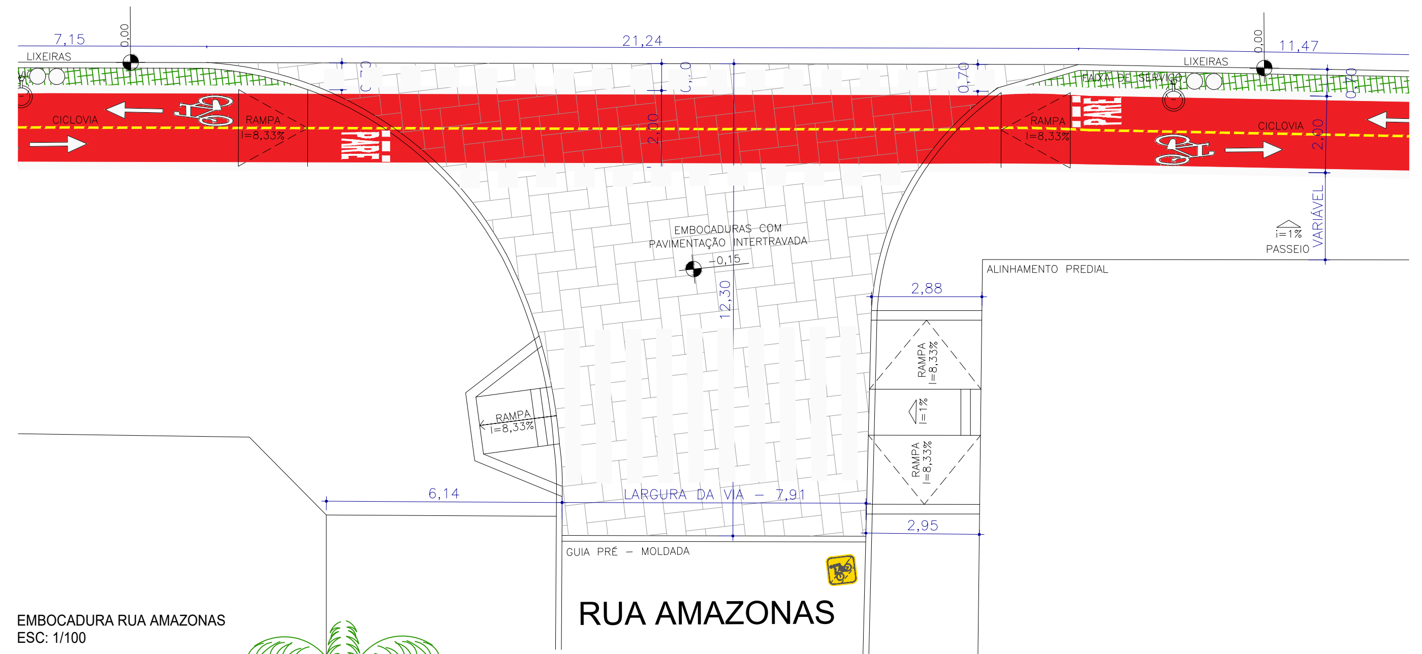
EMBOCADURA RUA AMAZONAS ESC: 1/100