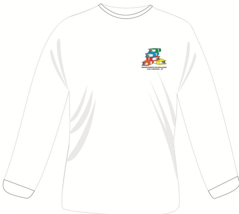
camiseta manga longa