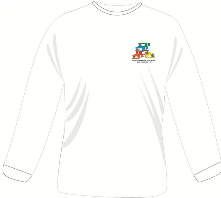
camiseta manga longa