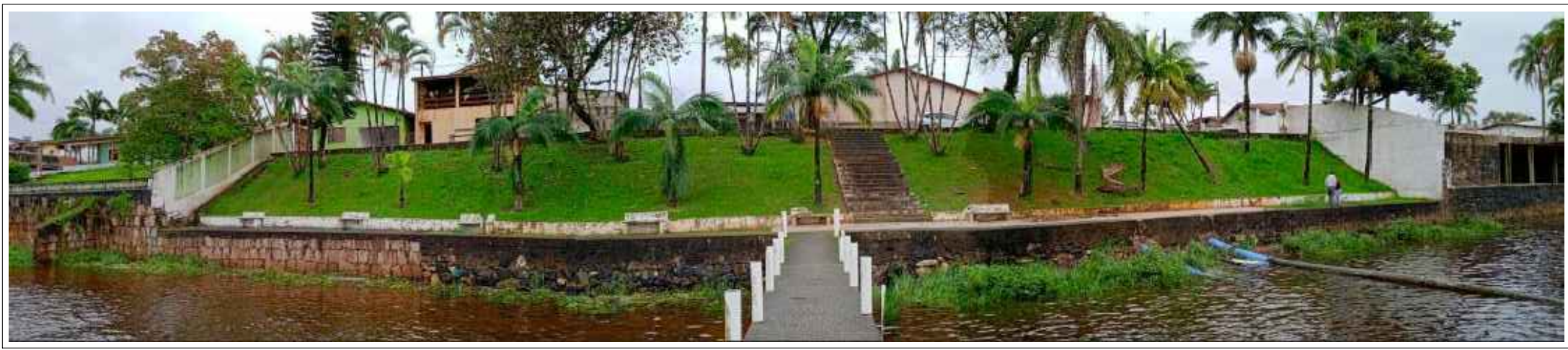
Imagem 01 - Situação atual