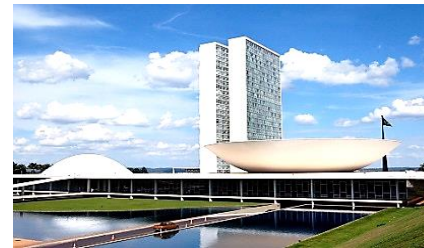
Congresso Nacional-Brasília (DF)