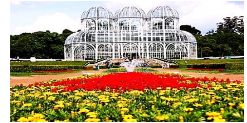
Jardim Botânico-Curitiba (PR)