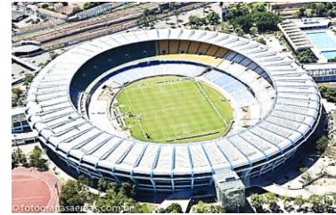
Estádio Maracanã-Rio de Janeiro (RJ)

a) Identifique, no espaço devido, a região brasileira à qual pertence cada cidade.