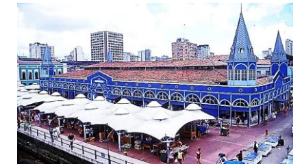
Mercado de Ver-o-Peso-Belém (PA)