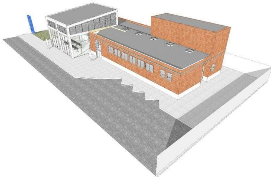
figura03 – Perspectiva