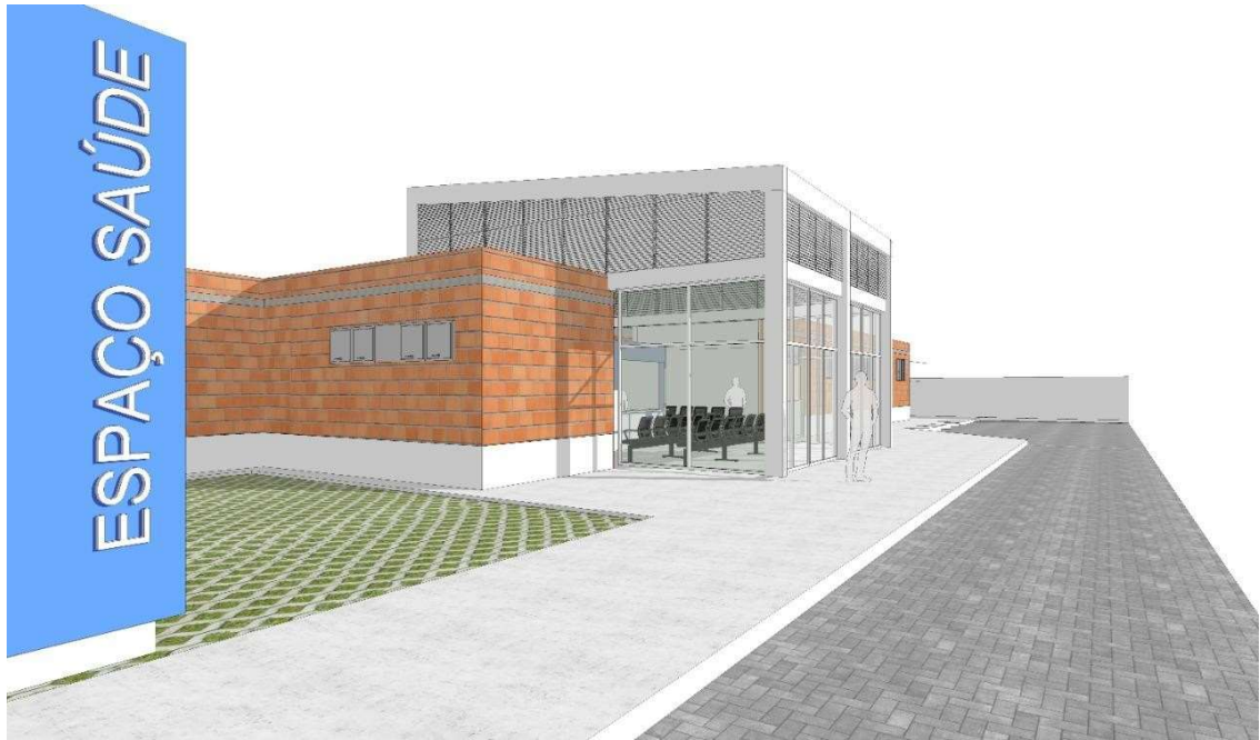
figura02 – Perspectiva