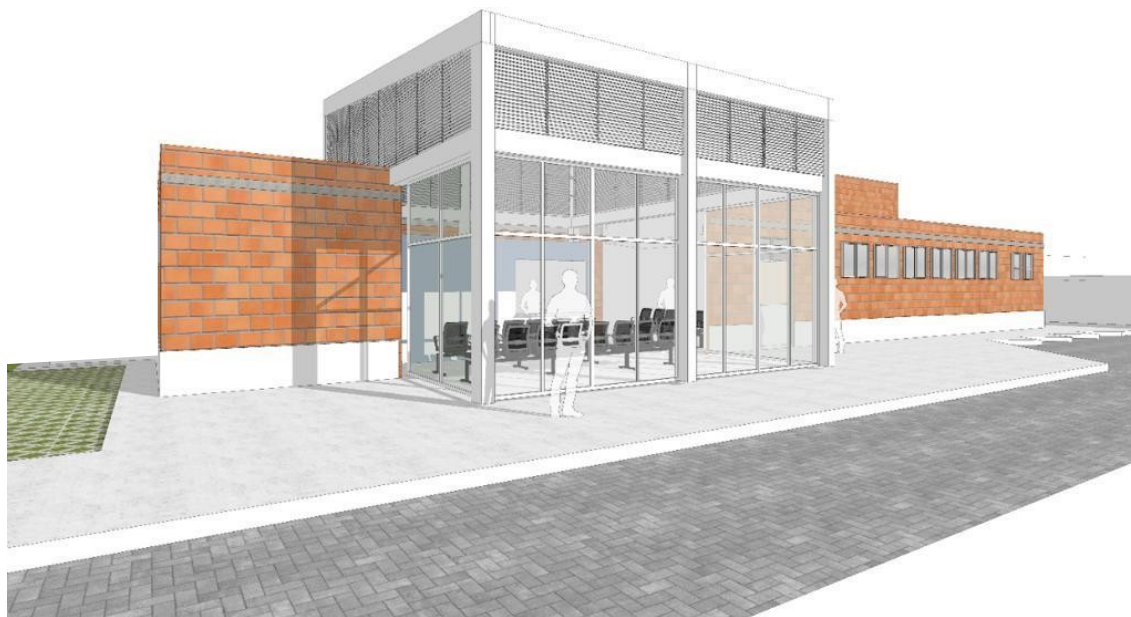
figura04 – Perspectiva