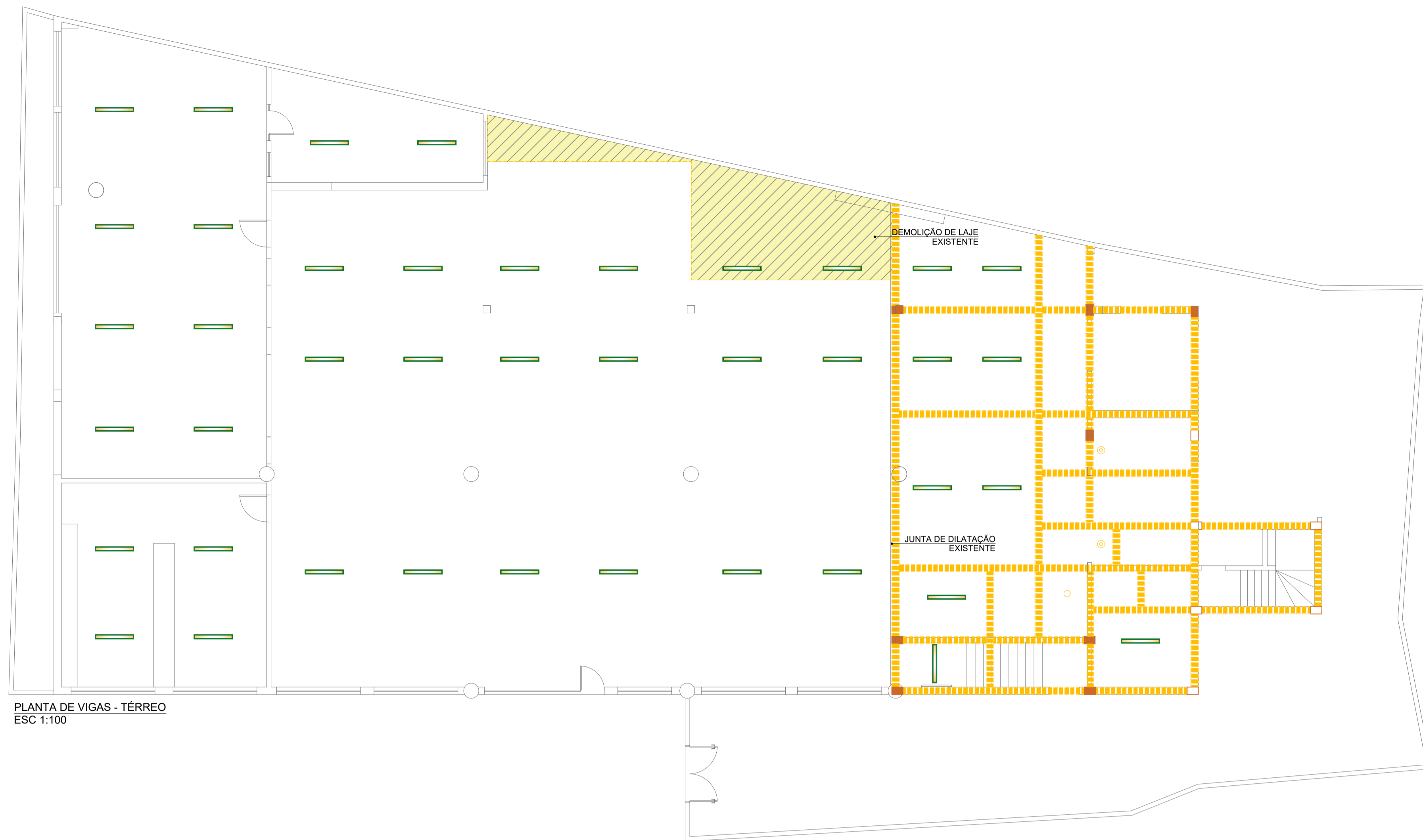
PLANTA DE VIGAS - TÉRREO ESC 1:100