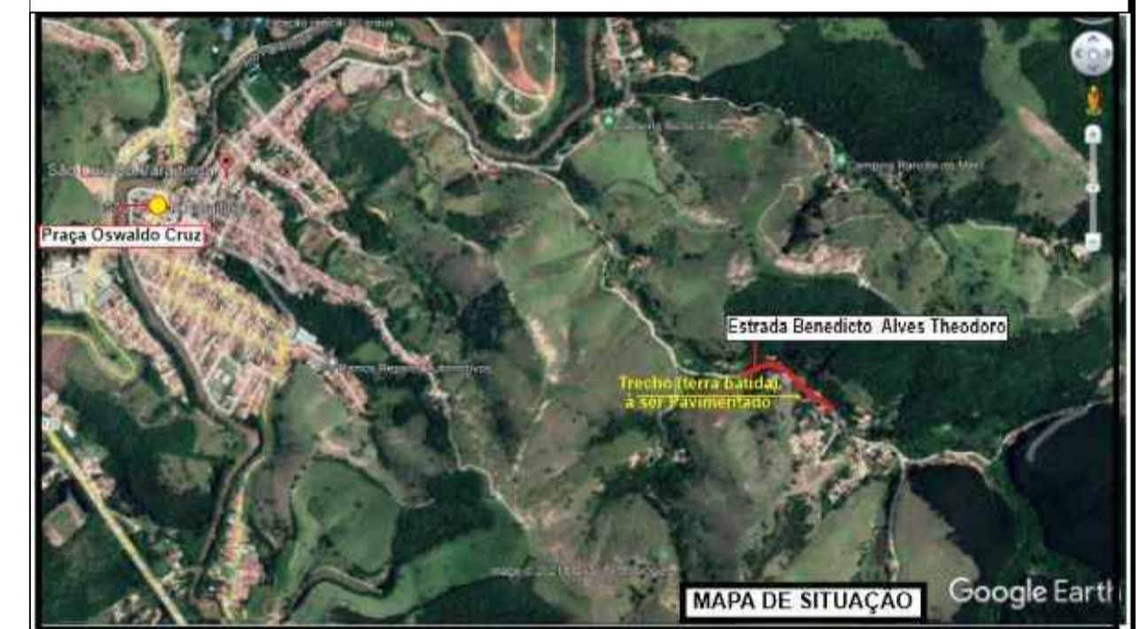
MAPA DE SITUAÇÃO Google Earth