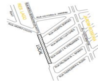
SITUAÇÃO Sem Escala

Sistema de Coordenadas Coordenadas Planas Sistema U T M Elipsóide: Sirlgas2000-BRASIL(BRGE) Meridiano Central: W 51