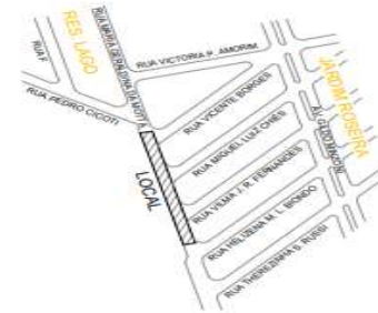
SITUAÇÃO Sem Escala

Sistema de Coordenadas Coordenadas Planas Sistema U.T.M. Epsóide: STras2000-BRASIL(BRGE) Meridiano Central: W 51