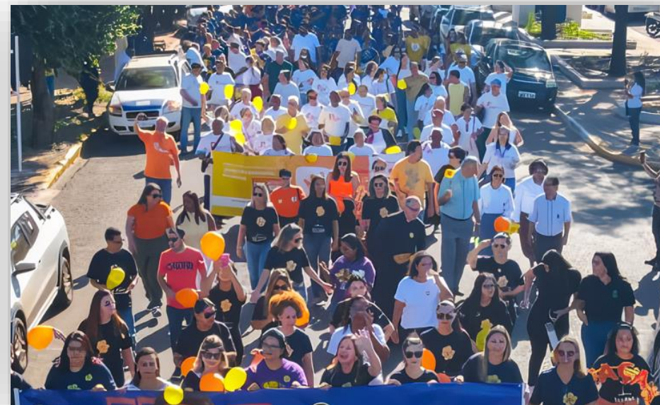
Unidade B088 – Três Lagoas/MS em ação alusiva ao 18 de maio