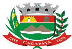
brasao-da-cidade.png 50 KB