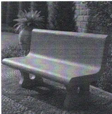
FIGURA 1 (BANCO DE CONCRETO)