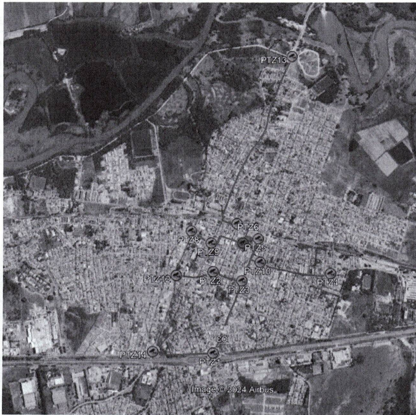
Rede Atual com as devidas câmeras a serem substituídas.

Prefeitura Municipal de Caçapava CNPJ 45.189.305/0001-21 Rua Capitão Carlos de Moura, 243, Vila Pantaleão, Caçapava-SP CEP: 12.280-050