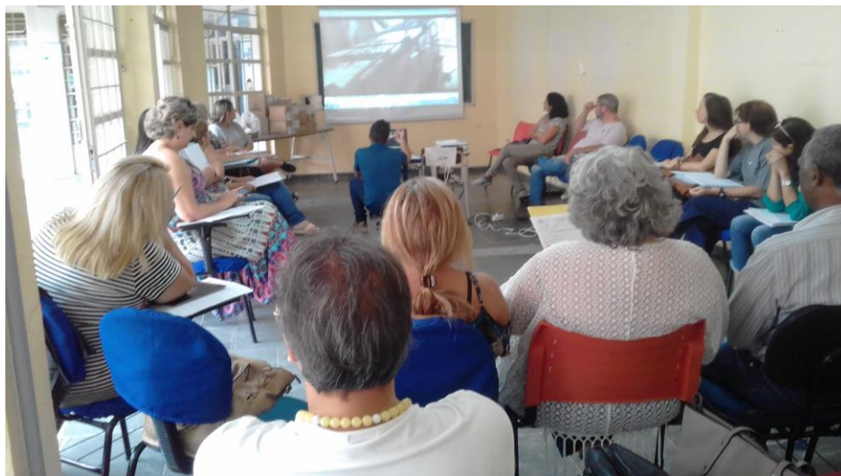
Coleta das PETs nas Unidades Escolares