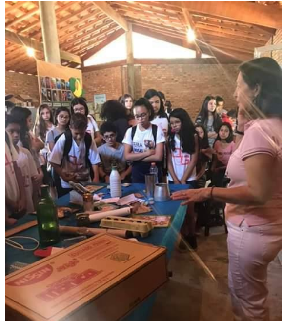
Dia da Árvore com ação de Plantio de mudas nativas de Mata Atlântica