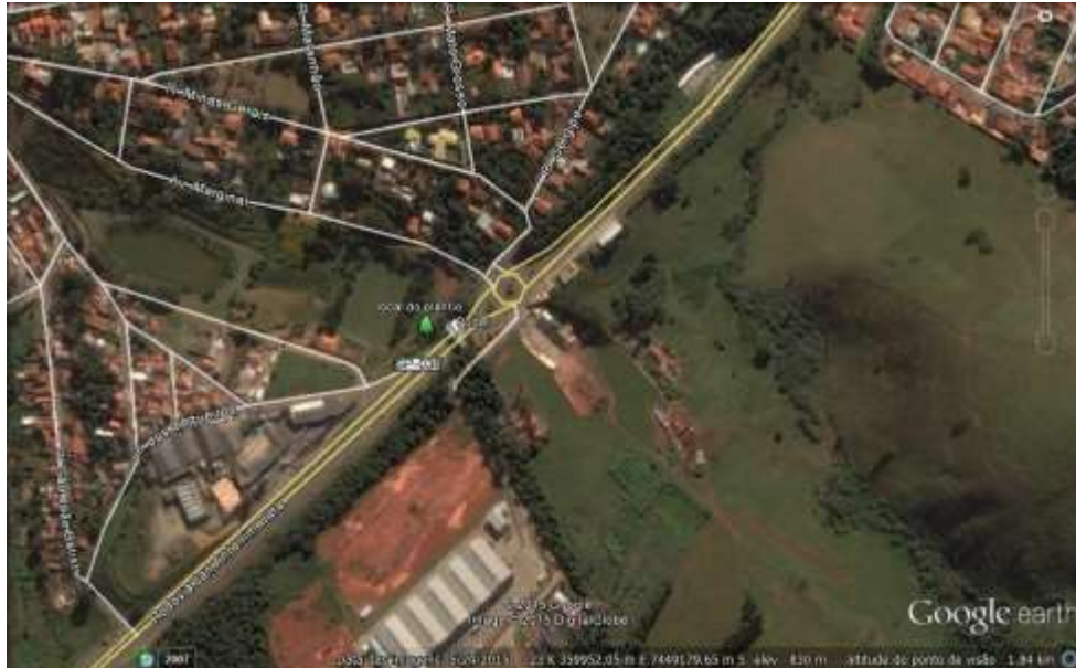
Imagem 02: Vista aérea do local de plantio 2 – Alça de Acesso

Imagem 01: Vista aérea do local indicando trechos canalizados e locais de plantio 1.