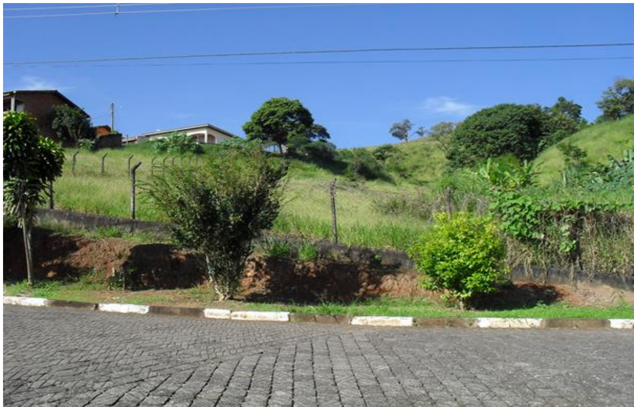
Imagem 01: Imagem da frente do local de plantio

Estado de São Paulo Av. Dr. Cândido Rodrigues, 120 - Tel. 4036-2040 CNPJ nº 45.279.627/0001-61 www.piracaia.sp.gov.br