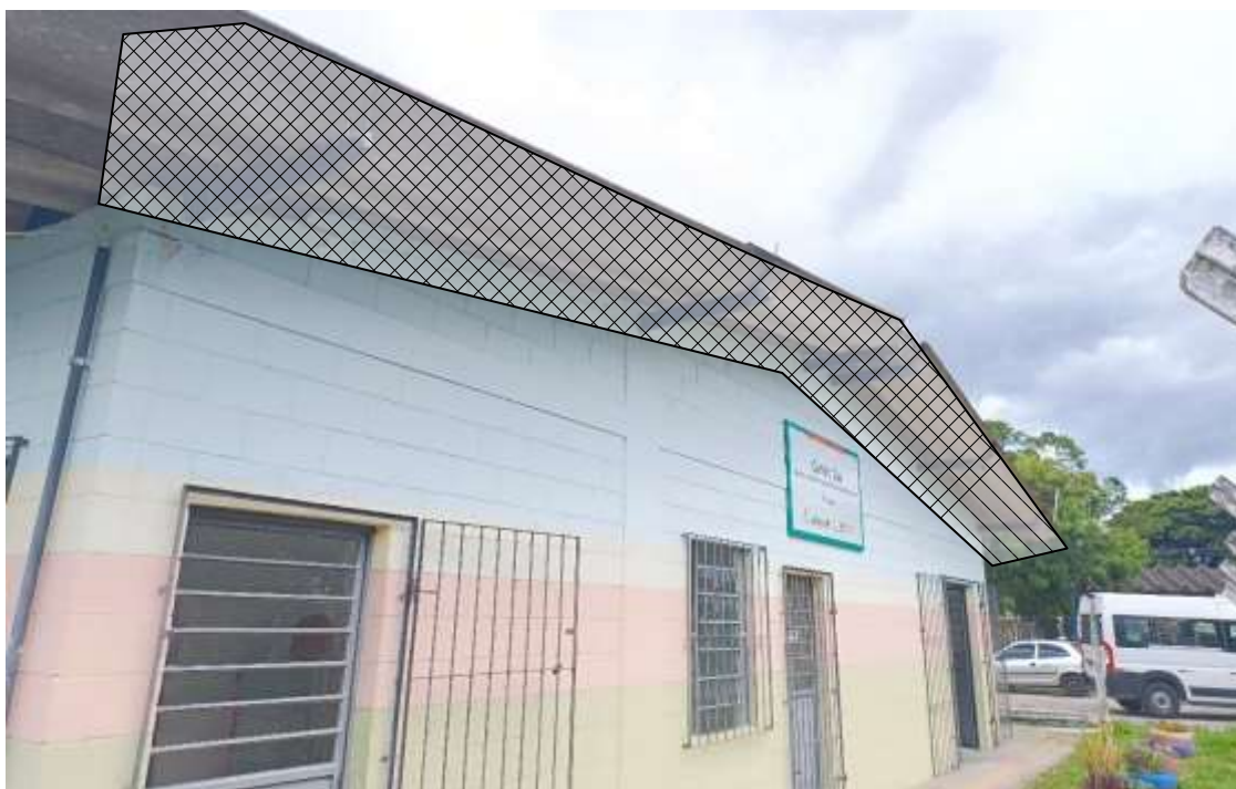
Figura 4. Bloco 2: Instalação de rede anti-pássaros nos dois lados (15x1m cada lado);