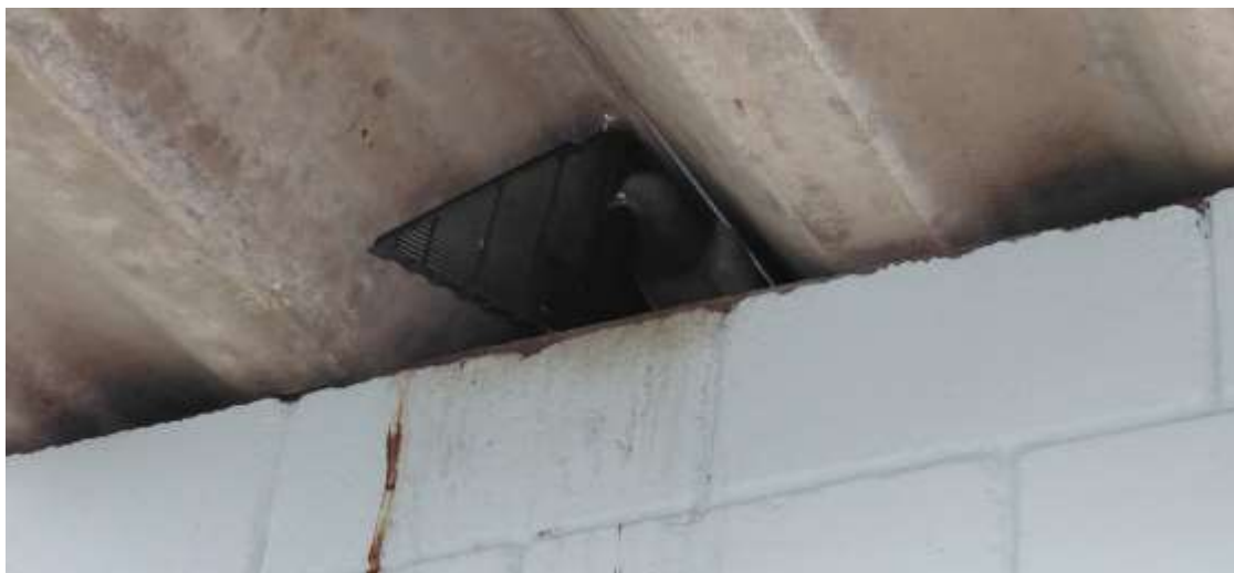
Foto 5. Substituição das passarinheiras de plástico por alvenaria;