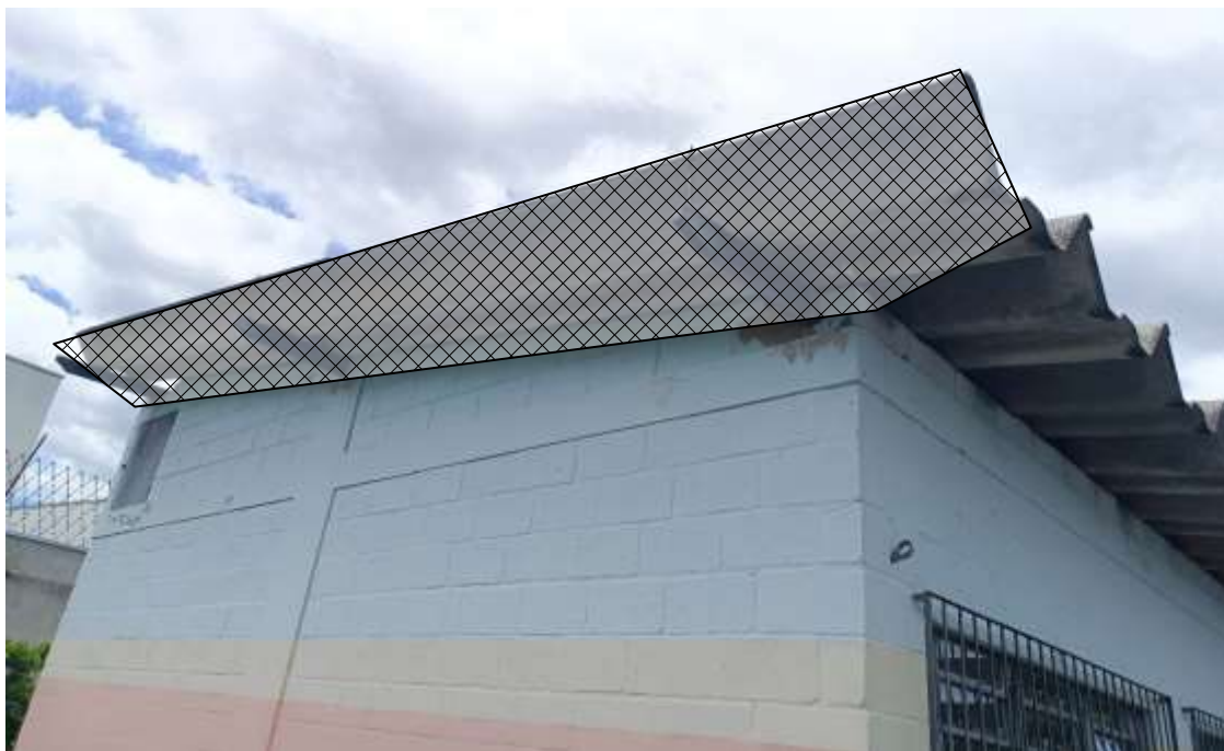
Foto 3. Bloco 1: Instalação de rede anti-pássaros nos beirais laterais (7,5x1,0m) cada lado;