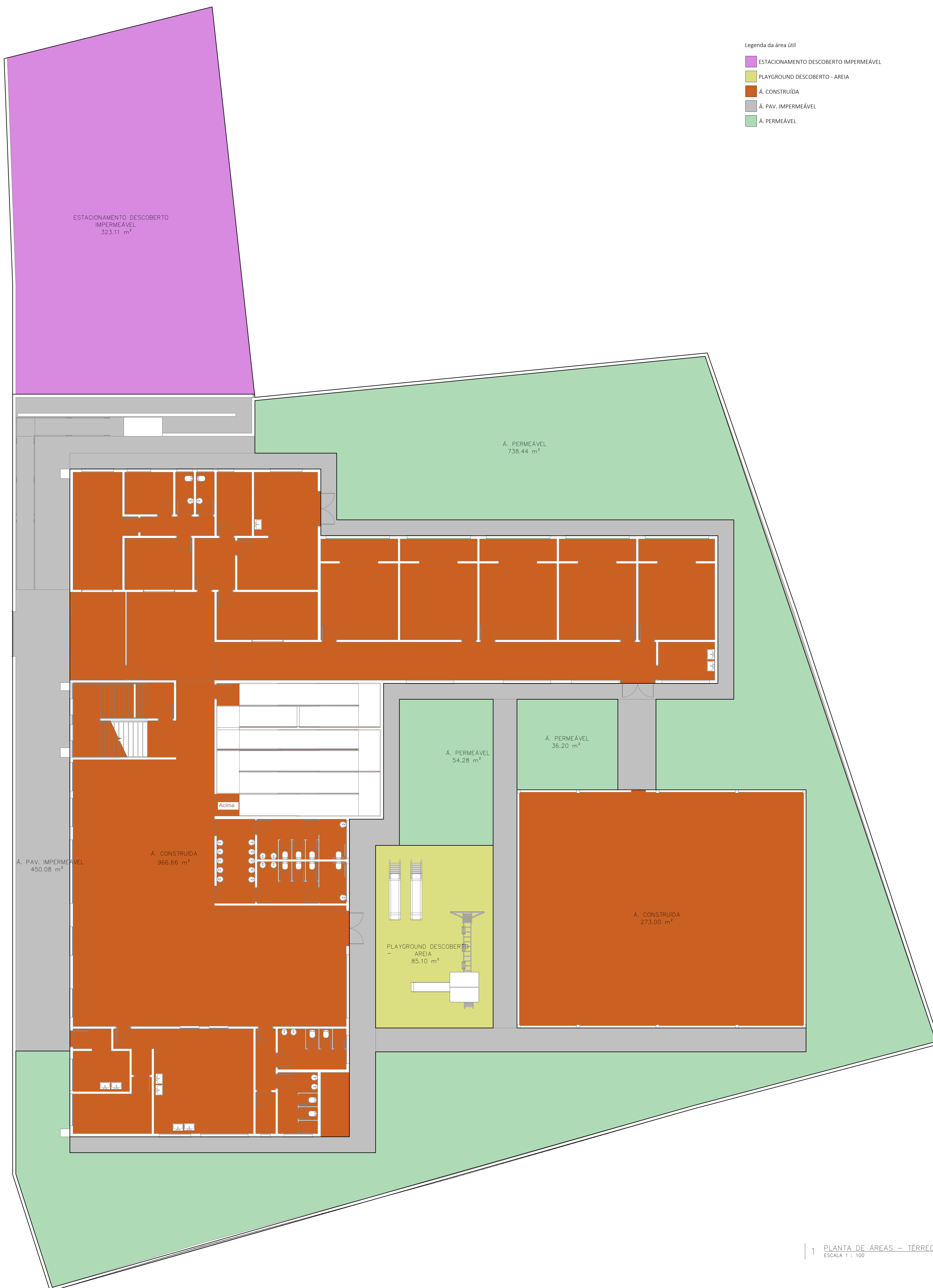
1 PLANTA DE ÁREAS - TÉRREO ESCALA 1 : 100