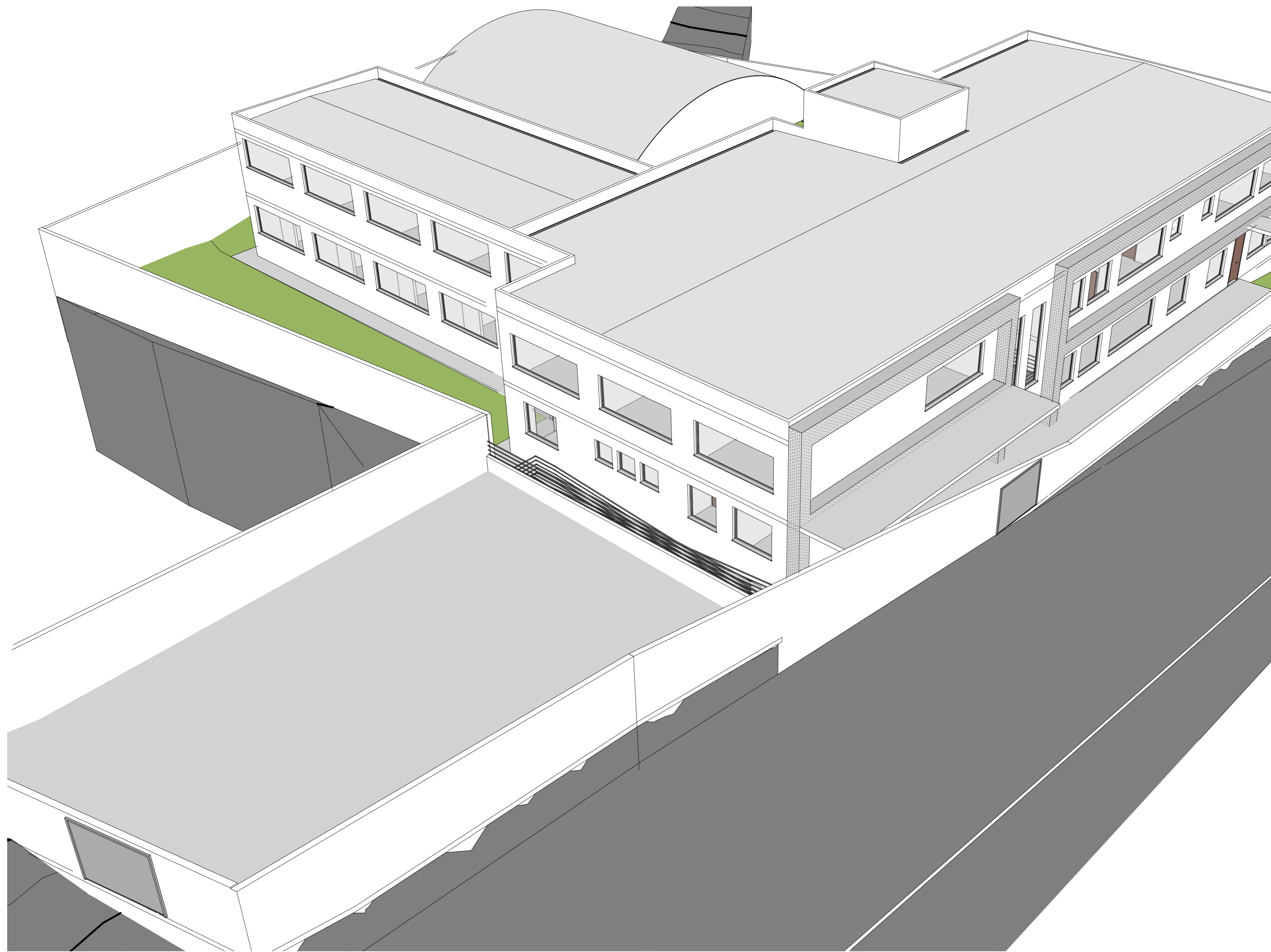
3 Vista 3D 3 SEM ESCALA