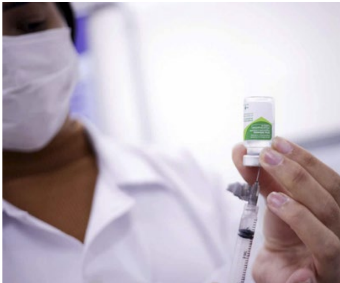
Moradores do estado de SP têm até o dia 15 de setembro para se vacinar contra a gripe gratuitamente

Crianças de até 11 anos têm liderado as hospitalizações por Síndrome Respiratória Aguda Grave (SRAG) causada por influenza, com 4.705 casos. Já entre os óbitos, a maior parte ocorreu em idosos, com 434 casos. Única forma de prevenção disponível para a população, a vacina da gripe é comprovadamente segura e conta com a validação da própria Organização Mundial da Saúde (OMS), tendo sido incluída na lista de imunizantes pré-qualificados do órgão em 2021. As cepas da vacina são atualizadas anualmente, já que os vírus influenza sofrem muitas mutações. Por isso, é importante se vacinar novamente todos os anos para garantir a proteção individual e coletiva. A vacina deste ano é composta por duas cepas do tipo A, H1N1 e H3N2 (do subtipo Darwin, que causou surtos no final de 2021 e predomi-