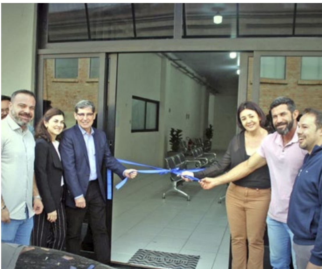
Novo prédio da Secretaria de Saúde está localizado na rua Dr. Alvim, nº 36, na região central do município

De acordo com a Administração, as novas instalações vão garantir mais segurança e conforto aos moradores