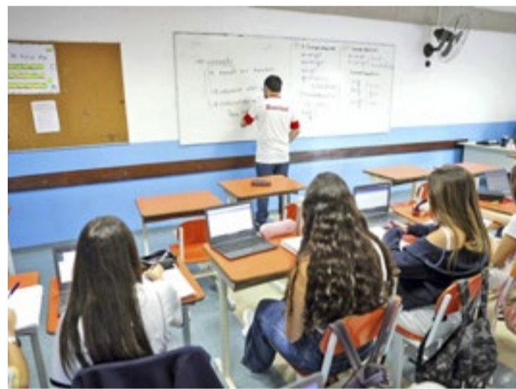
Seduc vai reforçar ações de “Busca Ativa” nas 5.300 escolas estaduais

Ensino, o contato e a notificação de pais ou responsáveis. Os alunos com frequência irregular e número excessivo de ausências terão garantidas possibilidades de recuperação da aprendizagem e de conteúdo. Na Seduc-SP, os profissionais que atuam nas escolas são apoiados por duas ferramentas: o Diário de Classe, com frequências e ausências registradas de forma informatizada obrigatoriamente desde 2020, e o Pannel Aluno Presente, que identifica pontos de atenção. Caso o acompanhamento individualizado não alcance