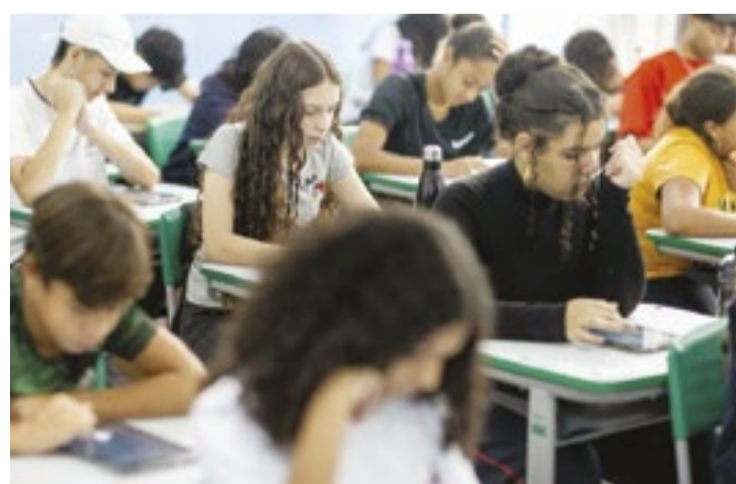
DIVULGAÇÃO/GOVERNO DO ESTADO

Todas as unidades escolares devem garantir, no mínimo, os 200 dias letivos previstos na Lei de Diretrizes e Bases (LDB). Se o calendário for alterado por qualquer motivo, as atividades suspensas po-