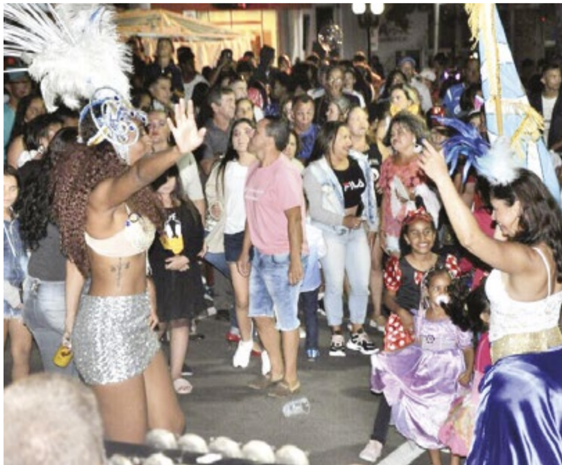
Carnaval Porto Feliz atrai moradores de toda a região de Sorocaba; confira programação especial