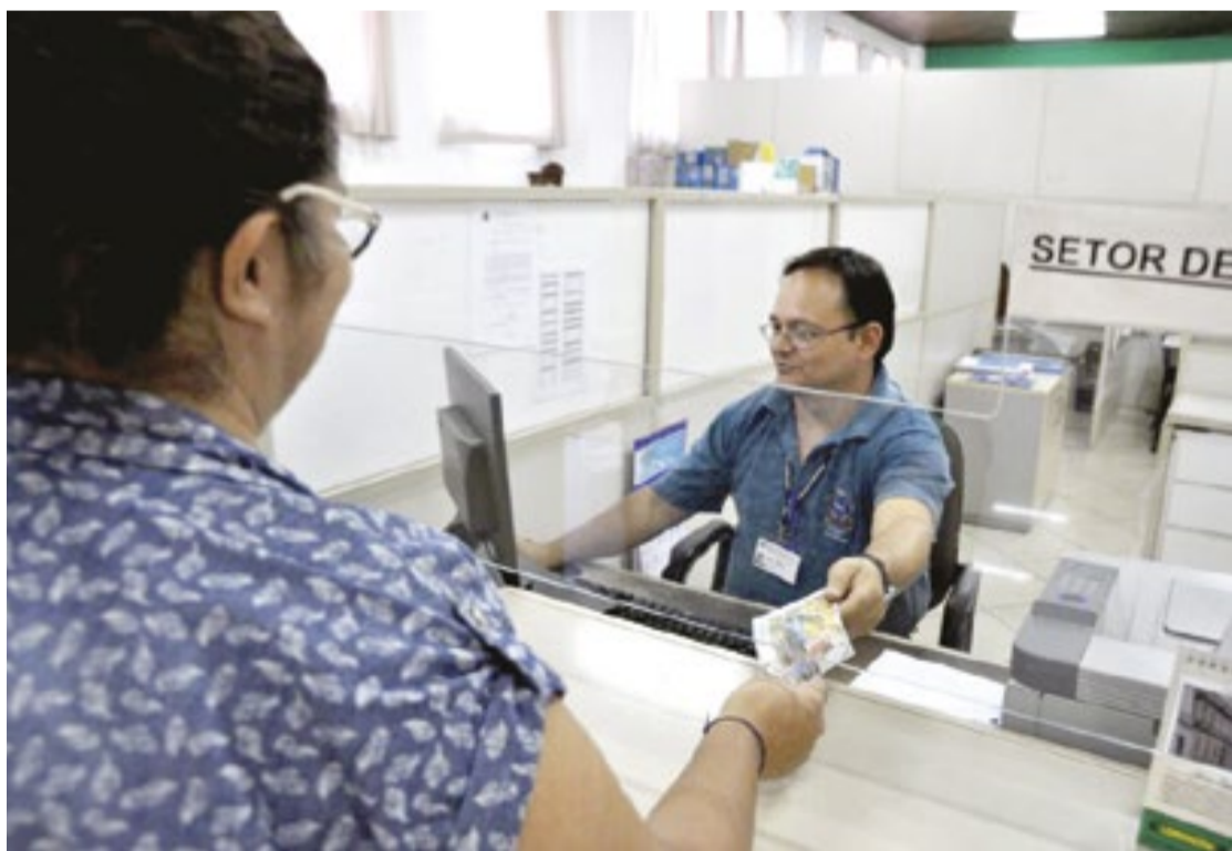
Para mais informações é possível procurar a Área de Arrecadação da Prefeitura de Porto Feliz

O interessado em consultar os carnês deve seguir os seguintes passos: www.portofeliz.sp.gov.br > aba Serviços > IPTU Online ISS on > Área Pública e ISS online