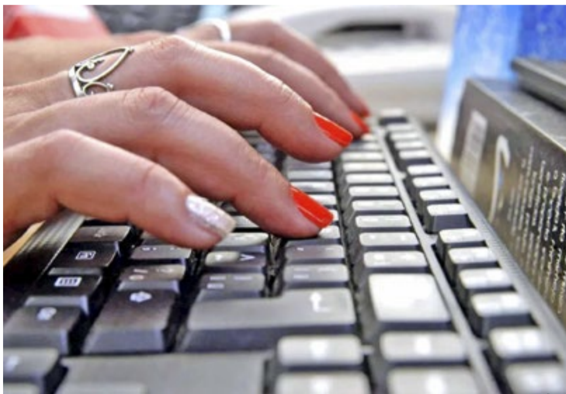
Para fazer a inscrição é preciso apresentar cópias do RG, CPF, comprovante de endereço e histórico escolar

As vagas são para pessoas a partir dos 16 anos. Para fazer a inscrição é preciso apresentar cópias do RG, CPF, comprovante de endereço e histórico escolar. Para menores de 18 anos é necessário CPF do responsável. (GSP)