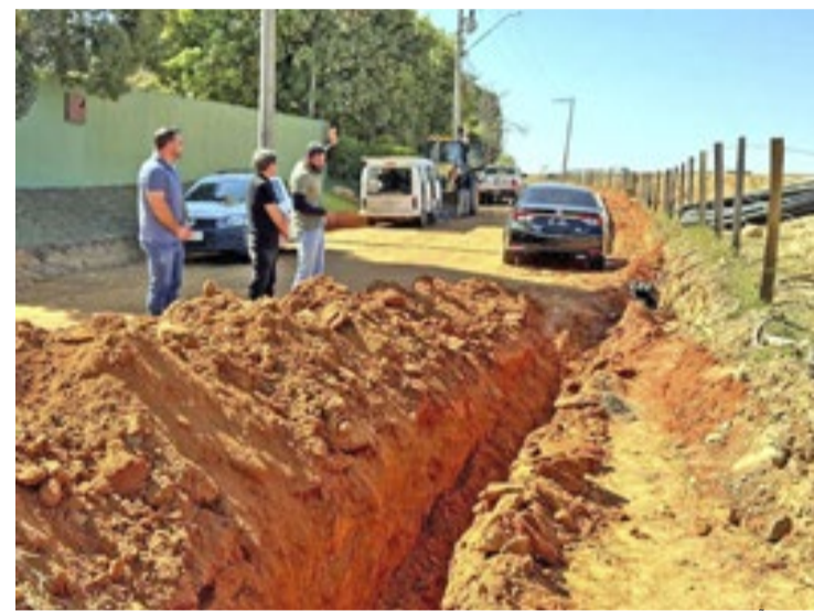
Estrada do Palmital passa por melhorias em Porto Feliz