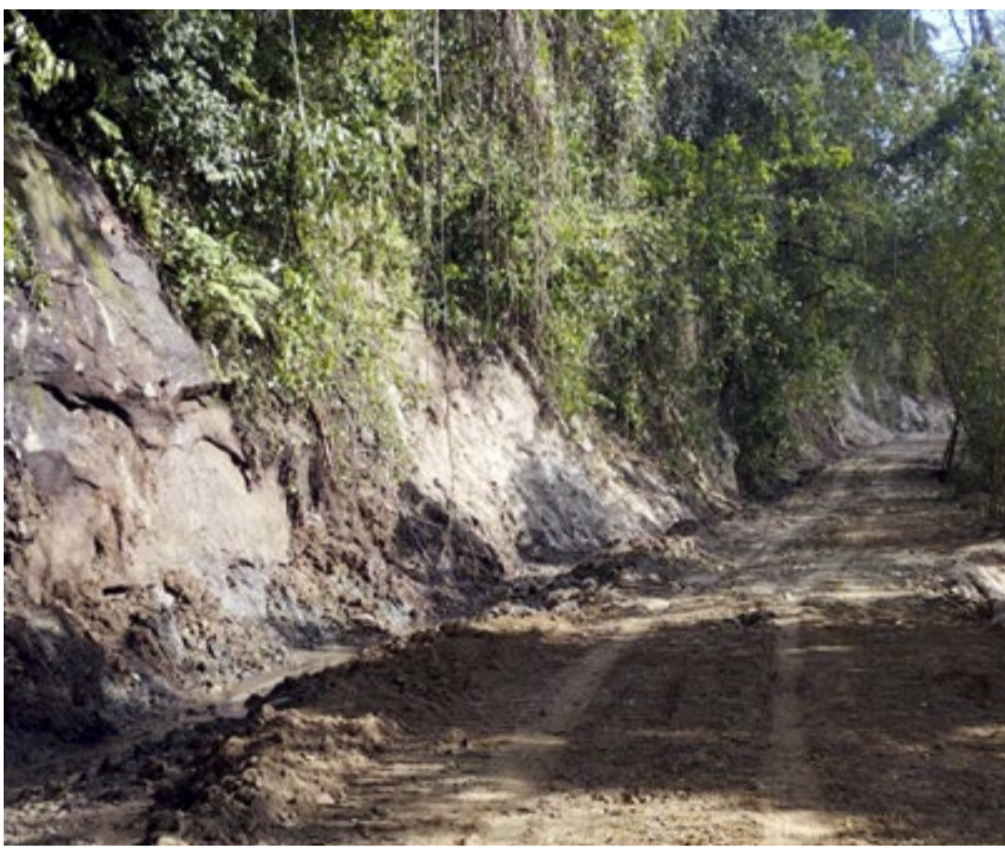
Estrada Parque liga o Parque das Monções ao Centro Controle de Zoonoses em Porto Feliz, no Interior

Agora, segundo o prefeito, após as devidas autorizações necessárias, em especial a do Condephaat, o local passará por uma revitalização completa, com instalação de cerca de 1 km piso intertravado, iluminação de led, drenagem, muro de arrimo e outros serviços.