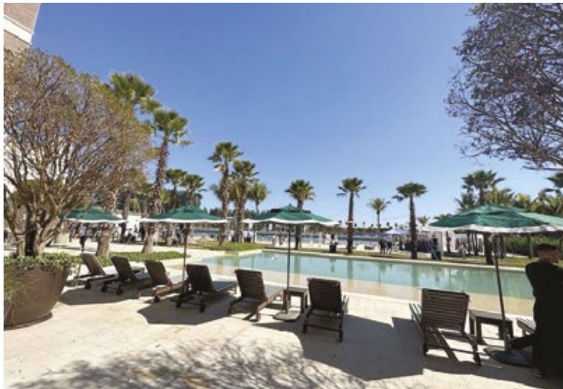
O complexo Boa Vista da JHSF é o maior empreendimento residencial e comercial da América Latina

O complexo Boa Vista da JHSF é o maior empreendimento residencial e comercial da América Latina. (GSP)