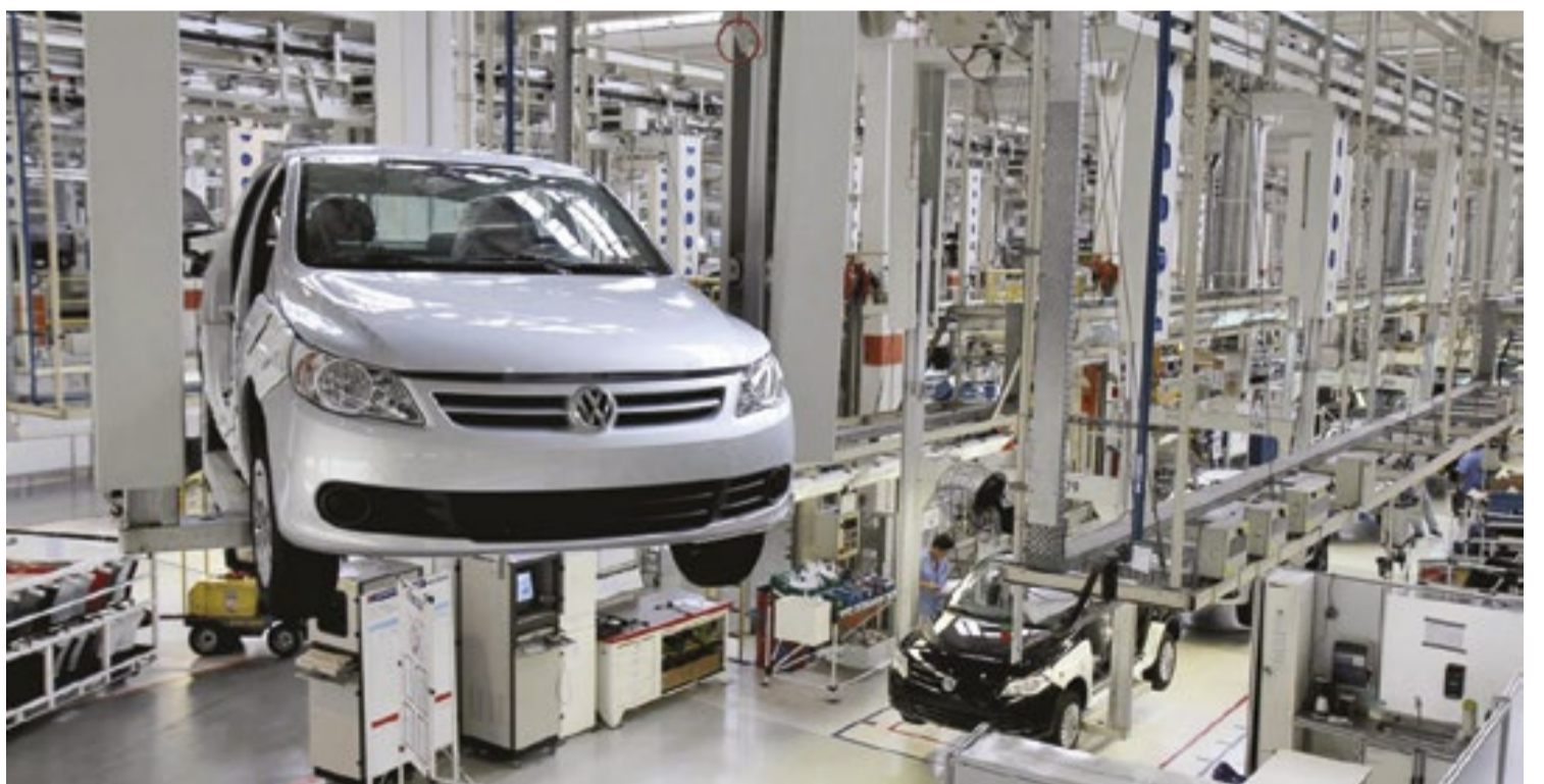
De acordo com o Governo de SP, destaques novamente pelos setores de serviços (3,6%), indústria (1,4%) e agropecuária (0,2%)

Há mais de 40 anos, o Sistema Estadual de Análise de Dados é referência nacional na produção e disseminação de análises e estatísticas socioeconômicas e demográficas de São Paulo. Os principais levantamentos englobam mercado de trabalho, tecnologia, pesquisas econômicas (PIB, investimentos, etc.), população, mortalidade e natalidade, entre outros. (GSP)