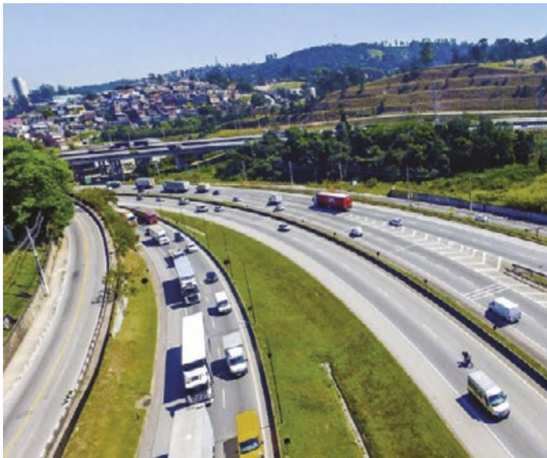
Rodovia Régis Bittencourt (BR-116), principal via que liga a cidade de São Paulo ao sul do País

Voltada para a capacitação de empreendedores e produtores rurais de micro, pequeno e médio porte que querem exportar, a iniciativa da Secretaria de Desenvolvimento Econômico (SDE) está com inscrições abertas para o 2º semestre e deve se aproximar, ainda neste ano, da marca de mil empresas atendidas.