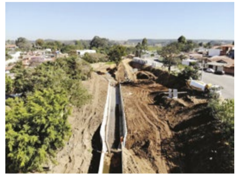
De acordo com prefeitura, obras vão evitar enchentes na cidade

sujo e abandonado em um lugar de contemplação e lazer”, disse o prefeito.