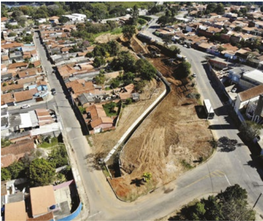
Equipes de Porto Feliz seguem com obras de canalização do Córrego Santa Eliza, no Interior de SP

“Além das questões de drenagem, essa ação tem o intuito de urbanizar e melhorar a qualidade de vida das pessoas que residem no entorno, com a criação de uma belíssima área verde, que irá dispor de paisagismo, plantio de diversas árvores e instalação de equipamentos públicos. Transformando o que era um terreno