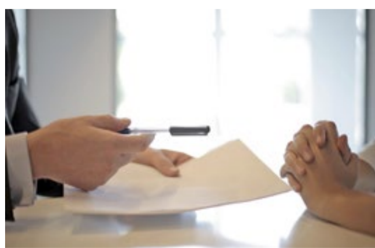
O Estado de São Paulo tem vagas disponíveis pelos Postos de Atendimento ao Trabalhador - os PATs - neste fim de ano

Ao todo, são 500 profissões com vagas disponíveis. As ocupações com o maior número de postos abertos são