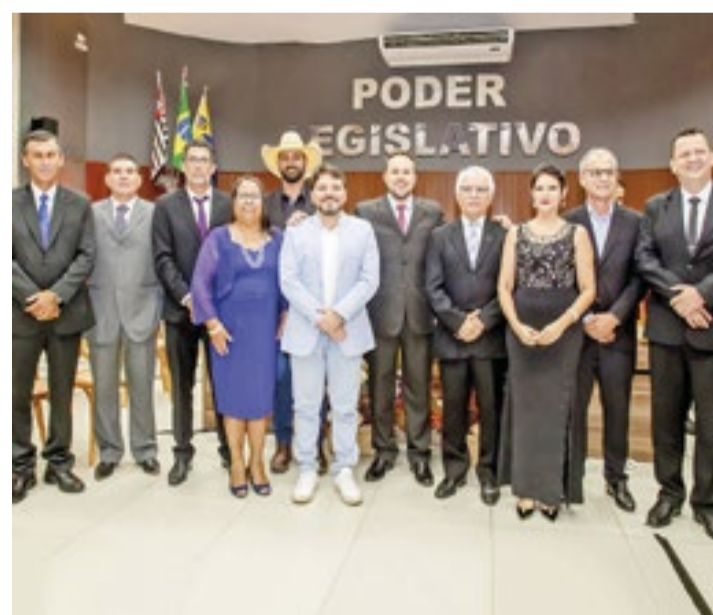
Com o encerramento do ano, a Câmara entra em recesso legislativo e a próxima sessão ordinária será realizada no dia 5 de fevereiro