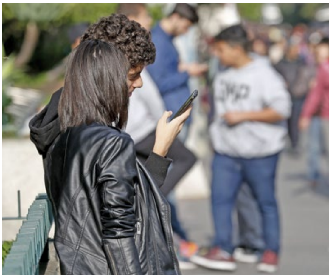
A chegada do 5G, a quinta geração de internet móvel, deve movimentar o mercado de trabalho em SP

"A chegada do 5G representa muito mais que uma navegação mais rápida para o usuário de internet. O aumento da conectividade terá impacto direto na atração de novas empresas para São Paulo, com crescimento