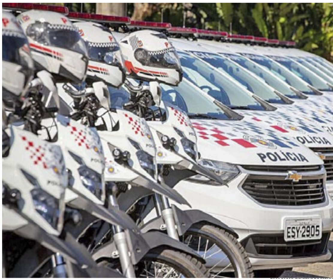
O interior do estado de São Paulo registrou o menor número de homicídios para o mês de novembro

De janeiro a novembro, houve a retirada de 6.406 armas de fogo ilegais no interior paulista, 558 a mais que no mesmo acumulado de 2022 quando 5.848 armas foram recolhidas, alta de 9,5%. O número de pessoas presas aumentou 3,7% na região, passando de 103.965 para 107.811. (Maria Eduarda Guimarães)