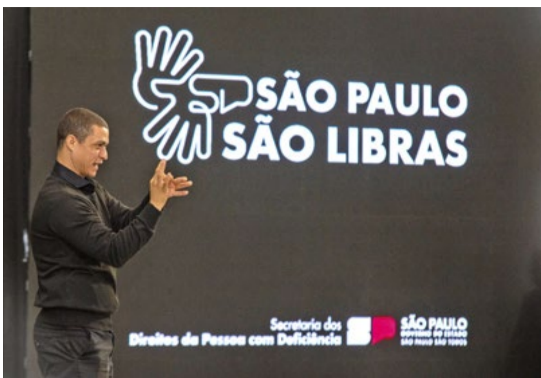
O curso será dividido em cinco turmas com diferentes horários; confira turmas e saiba como se inscrever

O curso abrange diversos tópicos, desde os fundamentos até expressões mais avançadas de Libras, permitindo uma comunicação eficaz com a comunidade surda. O conteúdo programático contempla os seguintes temas: O que é a Libras; Identidade surda; Cultura surda; Comunicação: surdo x ouvinte; Regionalismos na libras; Sistema de notação da libras; Alfabeto manual; Sinais pessoais; Cumprimentos/saudações; Condições climáticas; Advérbios de tempo e calendário; Singular e plural; Aníma; Expressões faciais; Materiais escolares e de escritório; Pronomes pessoais, posses-