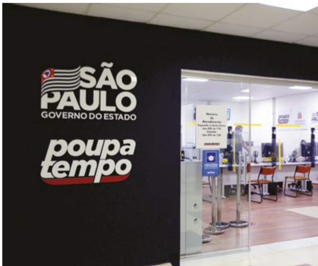
Unidades do Poupatempo no Estado ficarão fechadas nesta segunda-feira, dia 20 de novembro

As empresas ligadas à Secretaria dos Transportes Metropolitanos (STM) terão mudanças na operação no dia 20 de novembro por conta do feriado da Consciência Negra. EMTU, CPTM e Metrô seguirão o monitoramento das operações. (GSP)