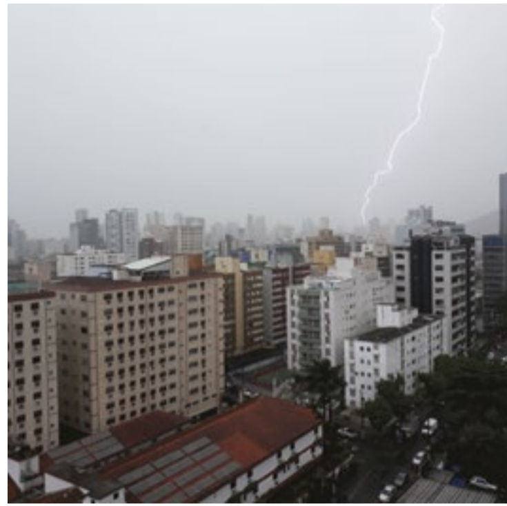
Brasil registrou 835 mortes e 266 hospitalizações causadas por raios

Está em estudo no instituto o impacto da atual onda de calor na incidência de raios registrada no país. “Essas ondas criam uma região quente mas seca, sem tempestade. O que poderia favorecer mais descargas elétricas seriam as