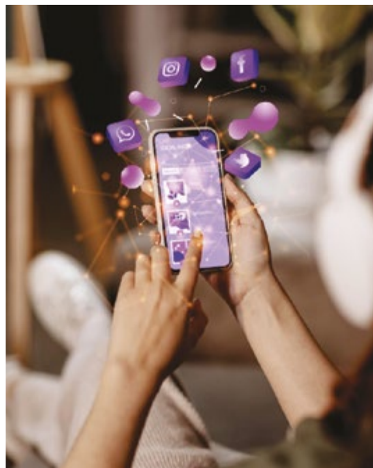
Velocidade de conexão piora quanto menor é o poder econômico

No entanto, a velocidade de conexão piora quanto menor é o poder econômico das classes, revelou a pesquisa. Já o compartilhamento com domicílio vizinho é maior na classe D/E, com 25% do total de lares com acesso à inter-