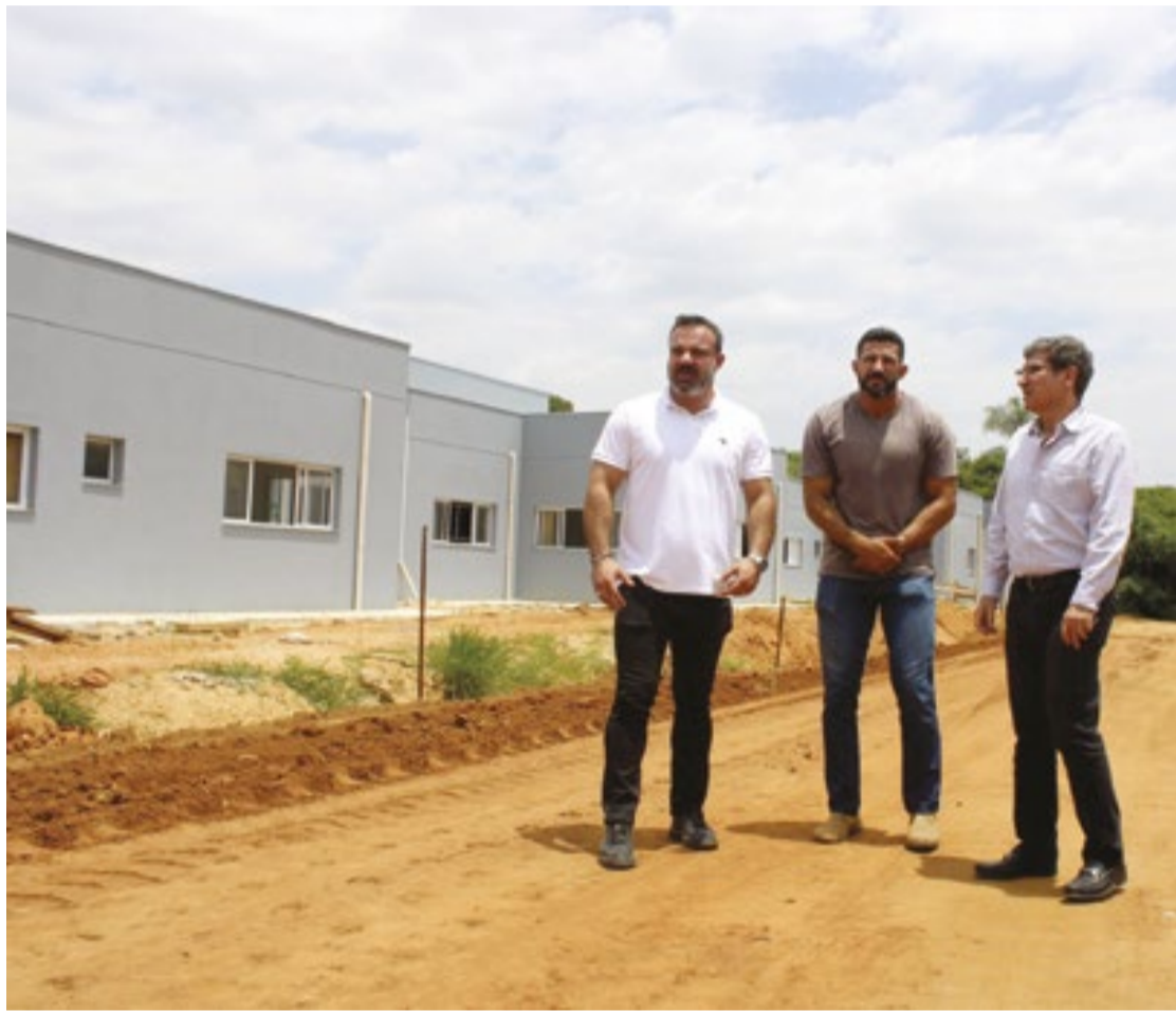
Nova unidade vai reforçar os atendimentos de urgência e emergência do SUS na cidade paulista

Entidade filantrópica sem fins lucrativos, a Santa Casa dedica pelo menos 60% dos seus atendimentos e procedimentos aos pacientes do Sistema Único de Saúde (SUS). (GSP)