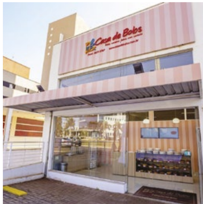
Casa de Bolos oferece mais de 100 opções de bolos caseiros

Com investimento total de R$ 36,5 mil, o formato home office é o mais em conta, com prazo de retorno de 12 meses e faturamento médio mensal de R$ 80 mil. (Gladys Magalhães)