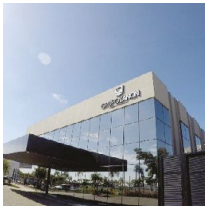
A corretora de seguros Seguralta tem 55 anos no mercado