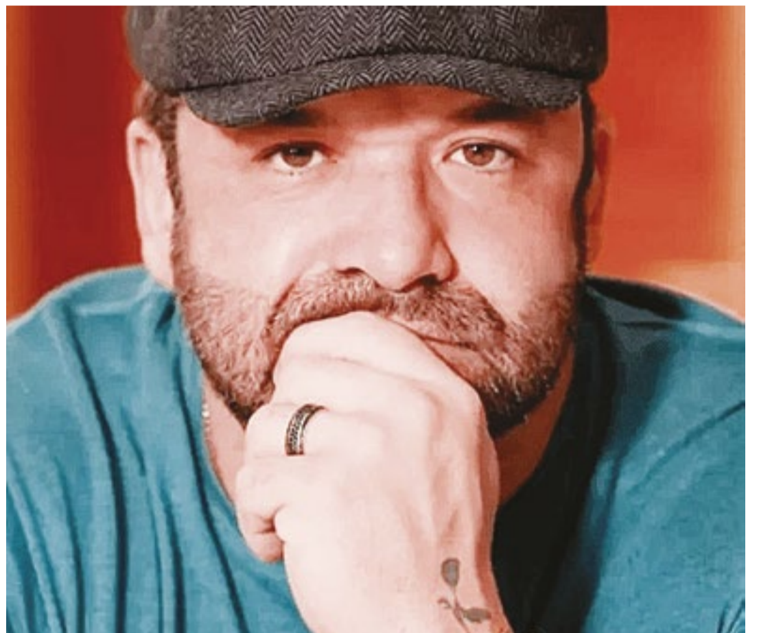
O empresário chegou a ser preso em outubro, em Abu Dhabi, mas acabou solto após pagar fiança. Depois de tratativas do governo brasileiro, os Emirados Árabes Unidos concordaram em extraditar o empresário

» Em maio, a denunciante norte-americana foi ouvida na primeira parte da audiência de instrução. Na época, ela já afirmou que Brennand teria apresentado um comportamento gentil, mas passou a agir de maneira agres-