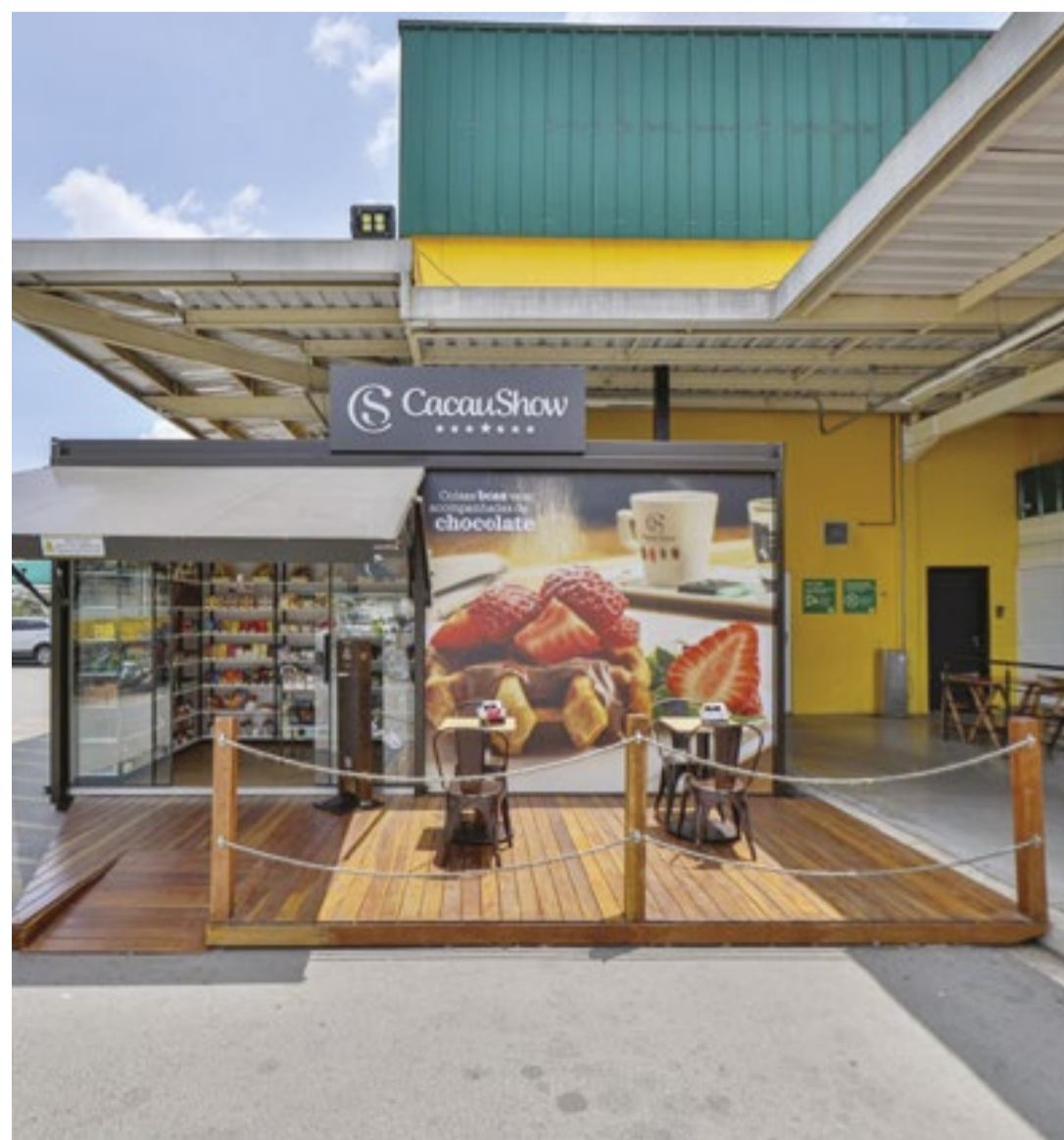
Com cerca de 3,7 mil operações, a Cacau Show é considerada a maior rede de franquias do Brasil

A rede, especializada na venda de chocolates, oferece quatro modelos de franquias, sendo que o que exige menor investimento inicial é o do tipo container, R$ 64,9 mil para o modelo de 6 mts, já contemplando taxa de adesão, primeiro pedido e instalações.