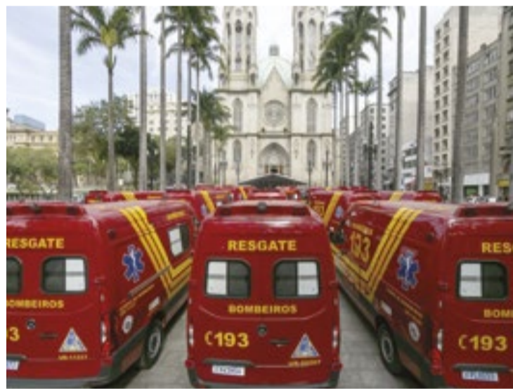
Corpo de Bombeiros recebe 48 novos veículos para atendimento de acidentes e emergências em cidades do estado de São Paulo

As novas viaturas são da marca Mercedes-Benz, modelo Sprinter Furgão 417. Cada veículo dispõe de equipamentos para suporte básico de vida e atendimento a vítimas com traumas e fratu-