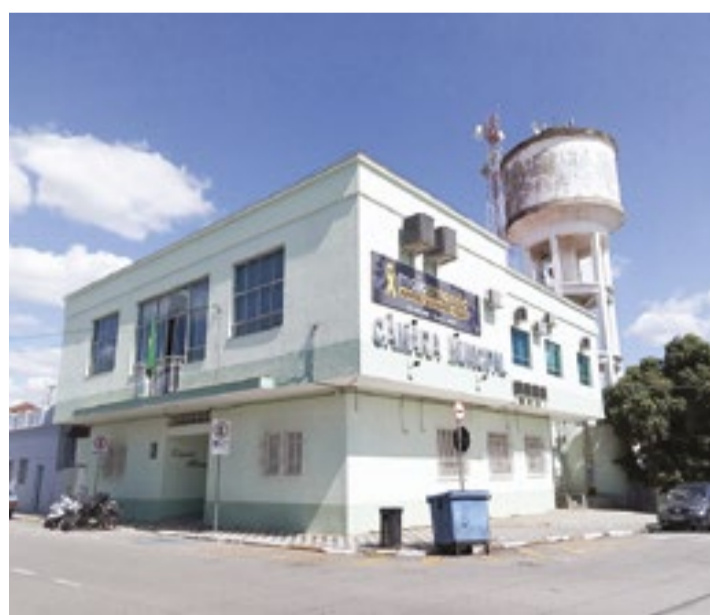
A próxima sessão ordinária será realizada no dia 3 de julho, a partir das 19h, na Câmara Municipal de Porto Feliz

» Os vereadores que votaram favoráveis ao projeto foram criticados nas redes sociais. O grupo alega a aprovação do projeto “pre-