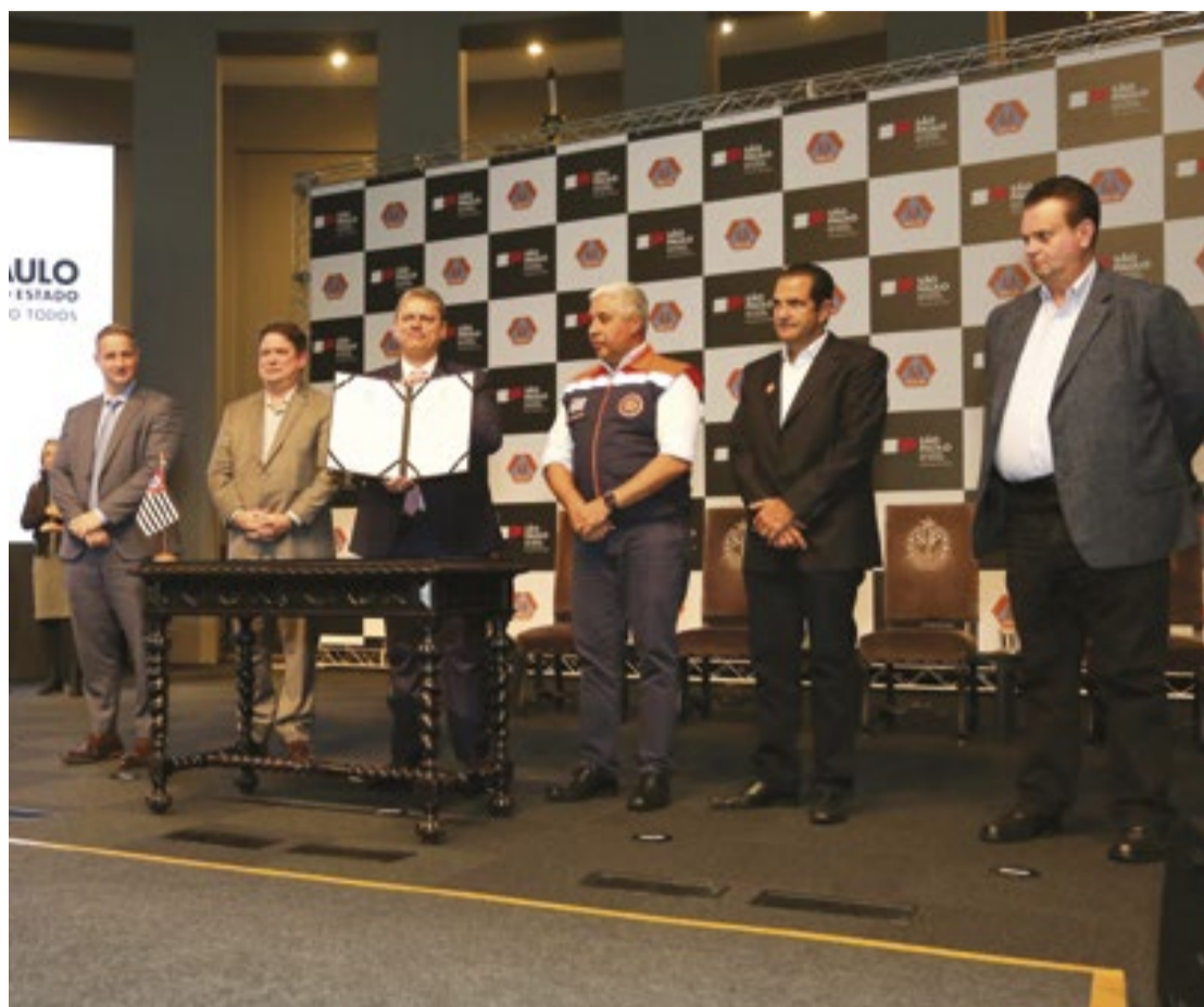
Tarcísio, durante cerimônia de assinatura dos convênios para obras e distribuição de equipamentos

Os 18 convênios de obras preveem a construção de pontes e aduelas nos municípios de Bananal, Campos Novos Paulista, Cardoso,