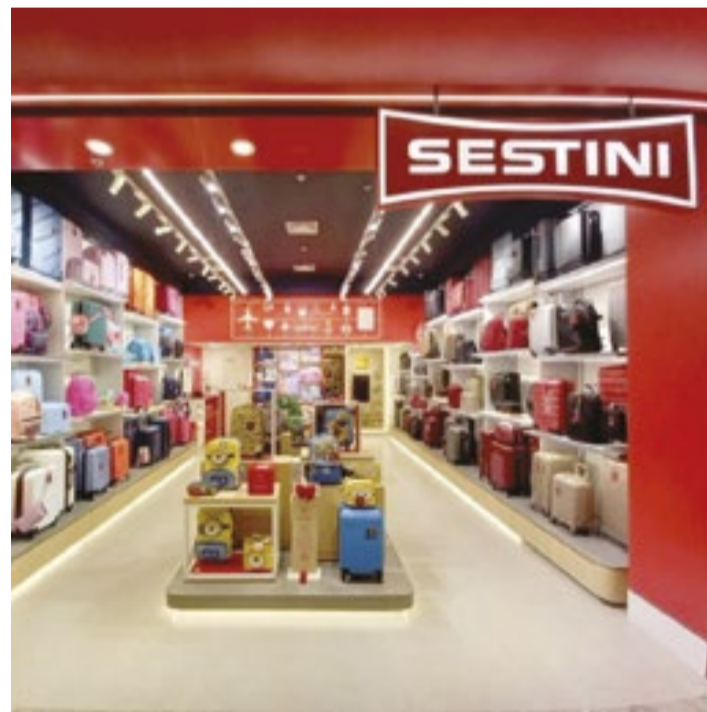
Com investimento de R$ 400 mil é possível ter franquia da Sestini