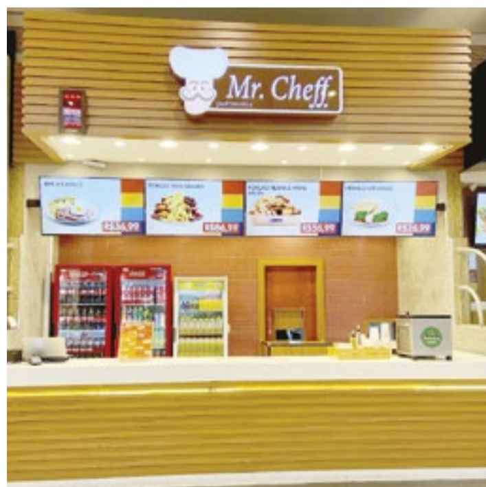
Fundada em Londrina (PR), Mr. Cheff atua no setor de alimentação