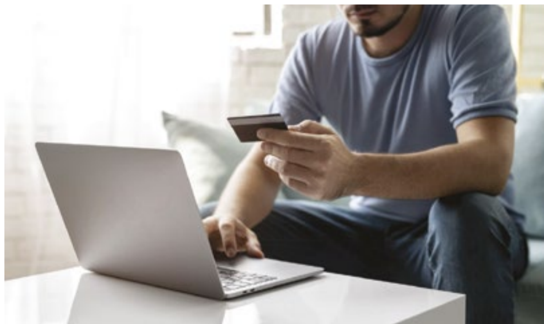
Negócios podem ser responsabilizados por prejuízos causados por informações vazadas sob seu controle

“A partir de canais no Telegram e fóruns online, estelionatários, por exemplo,