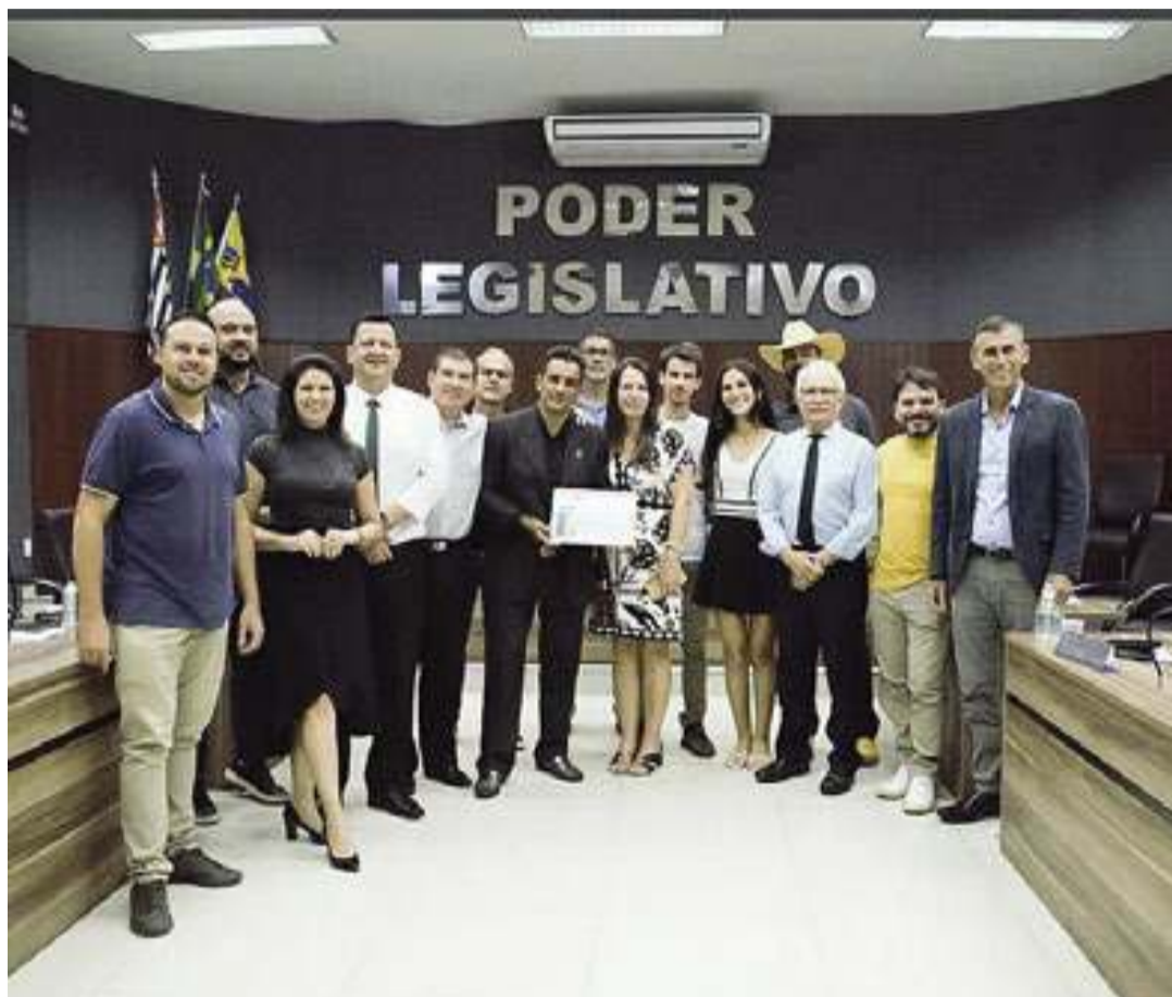
COMUNICAÇÃO CÂMARA DE PORTO FELIZ

“A execução fiscal de um crédito inscrito em favor do município demanda procedimento próprio e custos que lhe é inerente, en-