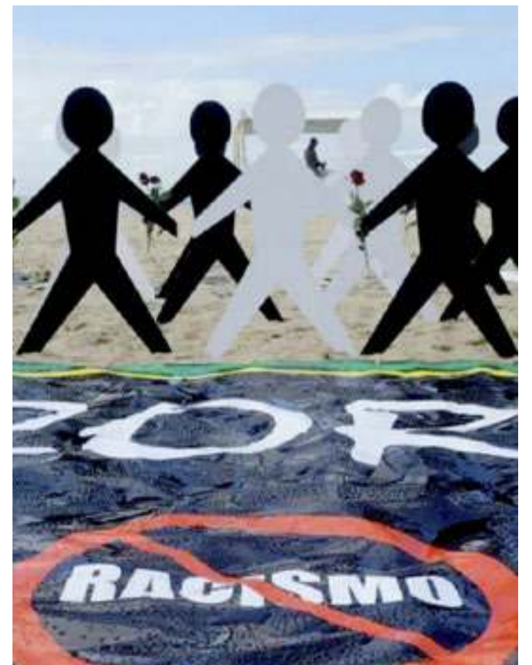
TÂNIA REGO/AGÊNCIA BRASIL

“O importante no projeto de educação antirracista é o que a gente vai fazer a partir dali, como a gente cuida da vítima, como fazemos que os agressores entendam a gravidade do que fizeram”, afirmou. (Carlos Petrólio/FP)