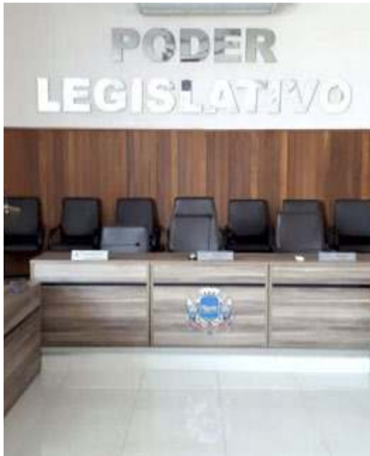
Além do cálculo médio do gasto por habitante, o painel do Tribunal de Contas (TC) analisa os gastos realizados pelas câmaras de SP

A Câmara da vizinha Boituva gasta R$ 71,56, um pouco menos que Porto Feliz. O legislativo de Tietê tem um