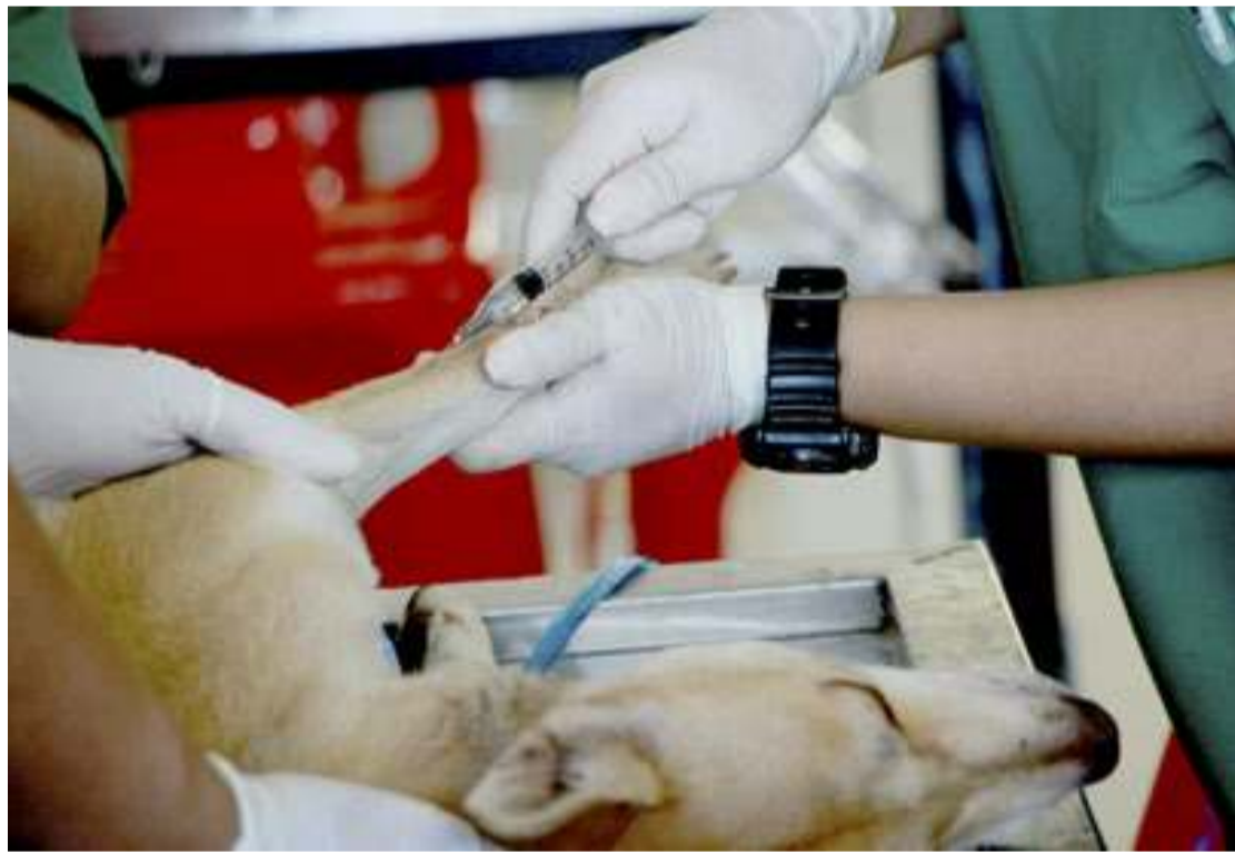
A Prefeitura de Porto Feliz divulgou uma série de orientações para os tutores

- O animal deve estar em bom estado de saúde. Se constatado alguma alteração no estado de saúde do animal, a cirurgia poderá ser cancelada;