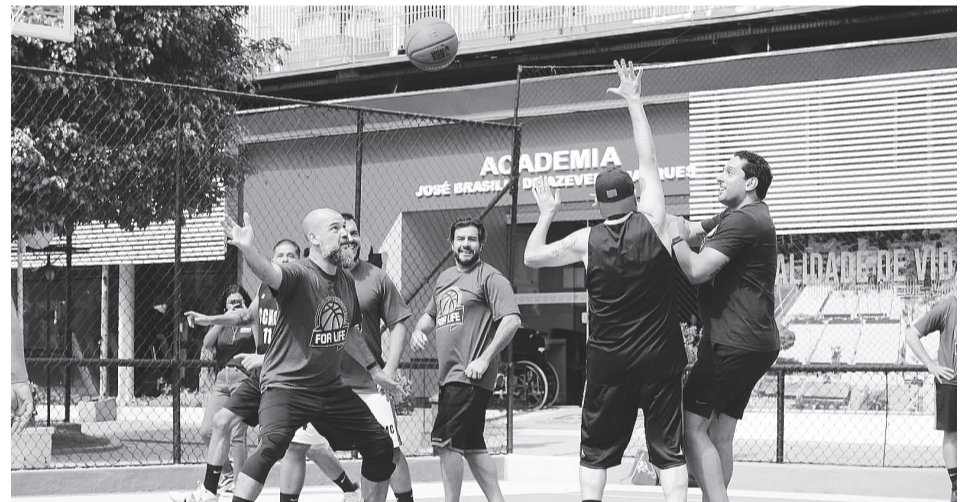
Estrutura do CCMC é uma das melhores da região e bastante utilizada para treinamentos e eventos