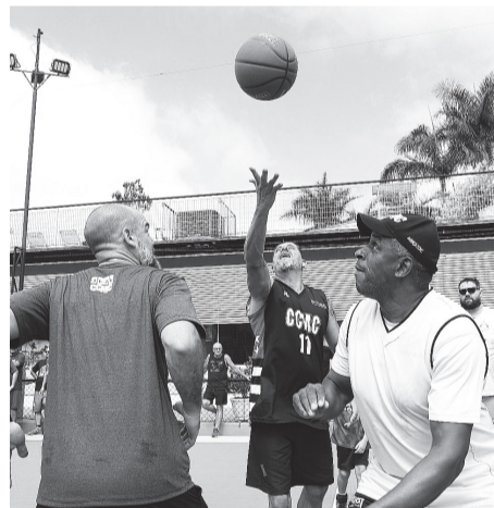
A quadra externa vai sediar as partidas do Torneio Início do 3º Summer League Basketball

corrida, 500 metros de natação e 3km de corrida, ou 750 metros de natação e 5km de corrida. A preparação já poderá ser colocada em prática no dia 2 de abril (domingo), na tradicional Maratona Internacional de São Paulo, nas distâncias 5km, 10km, 21km e 42km. As inscrições gratuitas podem ser feitas com o professor Paulo Pires. Mais informações: (11) 99581-4530.