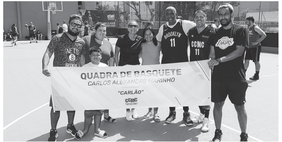
Quadra homenageia o atleta Carlão, muito conhecido no basquete nacional