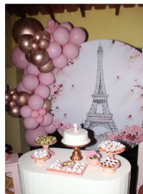
A decoração impecável e delicada, tema Paris