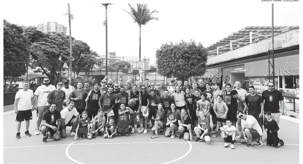
Estrutura foi modernizada, proporcionando mais segurança e qualidade aos praticantes