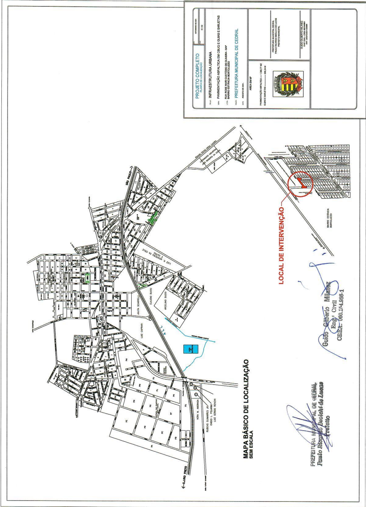
MAPA BÁSICO DE LOCALIZAÇÃO SEM ESCALA