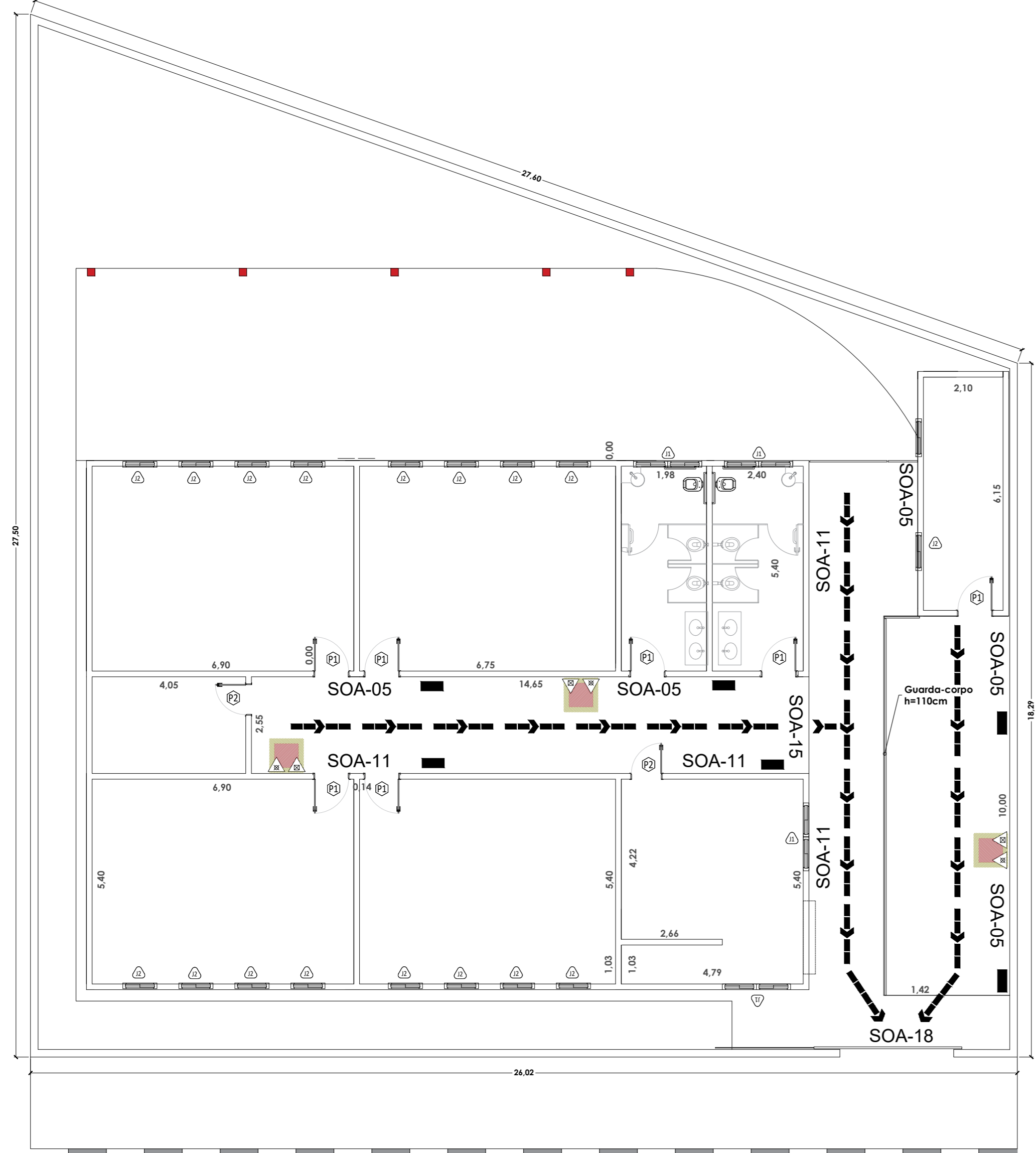
Planta Baixa Escala 1/100