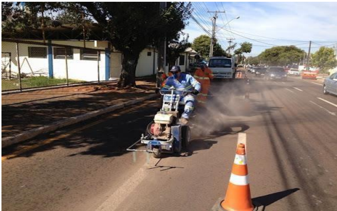
REMOÇÃO DA PINTURA EXISTENTE

1.3– REMOÇÃO DE SINALIZAÇÕES HORIZONTAIS EXISTENTES Compreende a remoção total de faixas de pedestres, linhas de divisão de fluxo, legendas no pavimento e demais marcações horizontais antigas, desgastadas ou posicionadas incorretamente. Os serviços deverão ser executados por processo manual ou mecânico, conforme a ABNT NBR 15405, garantindo a integridade do pavimento, a eliminação de marcas residuais visíveis e a não redução do atrito superficial. Os métodos mecânicos admitidos incluem microfresagem, hidrojateamento (água em alta pressão) e jateamento abrasivo, desde que controlados para evitar danos ao revestimento. Os métodos manuais podem envolver lixamento, raspagem ou aplicação de produtos específicos, sendo recomendados apenas para áreas pontuais ou de difícil acesso. Inclui ainda a limpeza da área e o transporte e descarte adequado dos resíduos gerados, em conformidade com as normas ambientais vigentes.