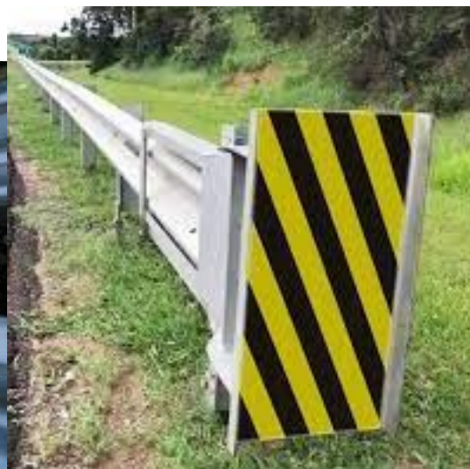
Estruturas similares de defensas