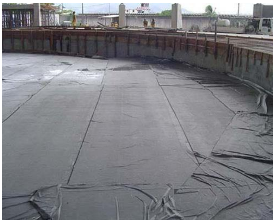
Cura de estrutura superficial em concreto armado com manta

A cura das estruturas em concreto armado foi considerado manta geotêxtil para ser umedecida regularmente e devidamente dispersa sobre a superfície de concreto superior.