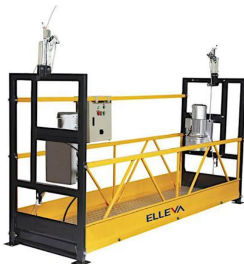
Modelo similar de balancim elétrico

ITEM 3.2 E 3.3 – Limpeza da armadura estrutura existente com escova de ações hidrojetamento, ITEM 3.4 E 3.5 – Preparo de base metálica e pintura em estrutura metálica existente.