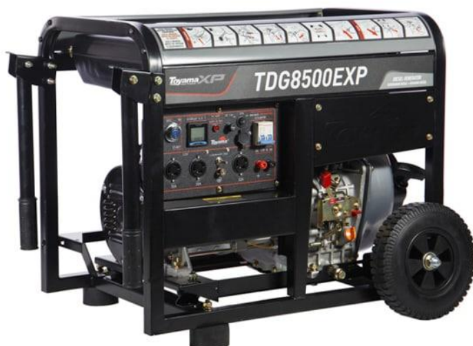
Modelo similar de grupo gerador

Gerador para atendimento na obra conforme necessidade de prazo prévio crítico para uso de energia elétrica. Autonomia de 7kVA com funcionamento à combustível. Aparelho de sustentação por rodas ou outro que ofereça proteção para o contato com o solo.