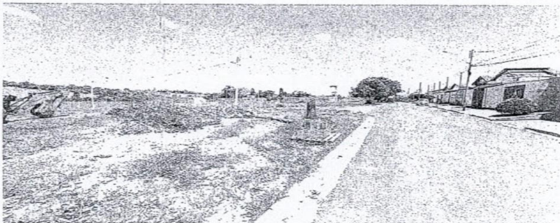
Rua Tibúrcio Moraes com a esquina da Rua Benedito Firmino de Oliveira s/n°