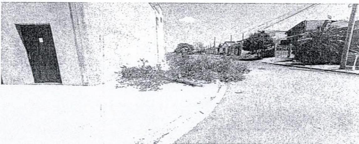
Rua Antonio André Ferreira filho com Benedito Firmino de Oliveira n° 11