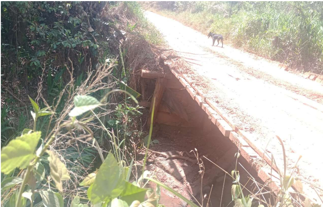
Figura 05 – Ponte sobre o Córrego Quebra Rabicho.

Através de levantamento em campo pode ser constatado nos pilares da ponte indícios no nível máximo da água em situações de cheia, a cota encontrada foi de: 727,45.