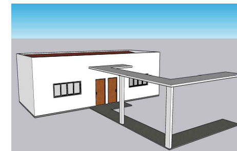
Fachada sem escala