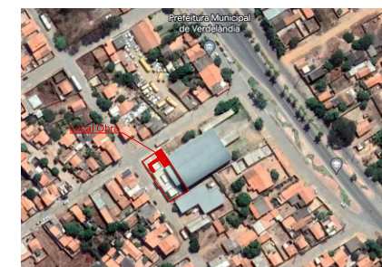
Localização sem escala