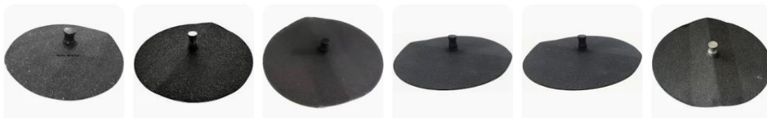
Imagem 02 – etiqueta contida no descascador de batatas: