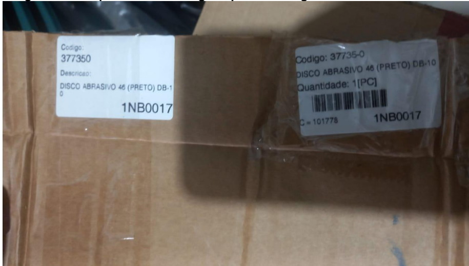
Imagem 03 – etiquetas na embalagem que foi entregue o atual disco abrasivo:

Praça Armando de Salles Oliveira, 200 CEP 18.500-047 Fones (15) 3283-8300 - (15)32838314 - (15)3283.8320 e-mail: compras@laranjalpaulista.sp.gov.br