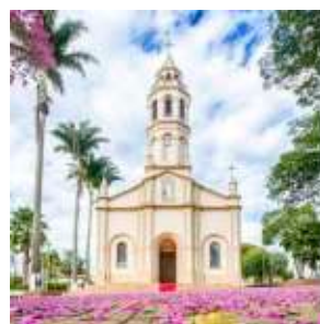
PARÓQUIA SANTO ANTÔNIO