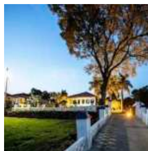
FAZENDA VILLA CAFEIRA

A Gruta de São Sebastião, localizada na entrada do distrito de Laras, simboliza a devoção ao santo padroeiro. Possui uma capelinha simples com a imagem de São Sebastião e, acima, uma pomba representando o Divino Espírito Santo.