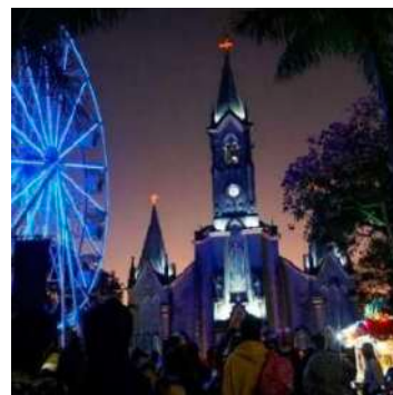
FESTA SÃO JOÃO BATISTA

Datadas de mais de 200 anos, as festas de São Sebastião e do Divino Espírito Santo destacam-se por sua tradição, cultura e fé.