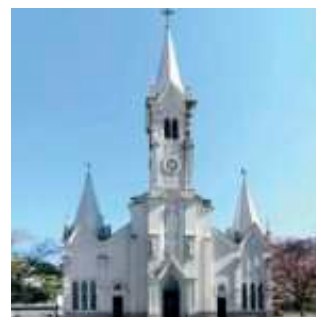
SANTUÁRIO ARQUIDIOCESANO SÃO JOÃO BATISTA