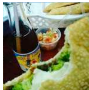
FEIRA DO PRODUTOR