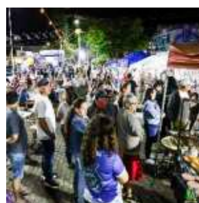
FEIRA DA LUA