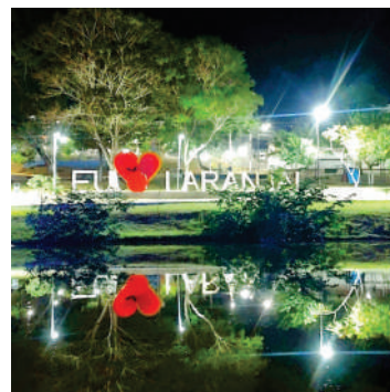
PARQUE PEDRO ZANELLA