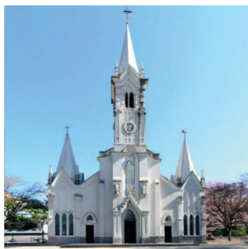
SANTUÁRIO ARQUIDIOCESANO SÃO JOÃO BATISTA