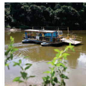
BALSA DO DISTRITO DE LARAS