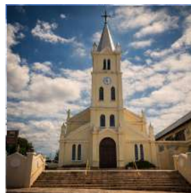
PARÓQUIA SÃO ROQUE