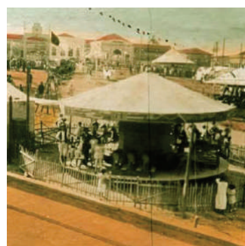
FESTA DE SÃO JOÃO BATISTA