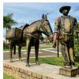
MONUMENTO AO TROPEIRO