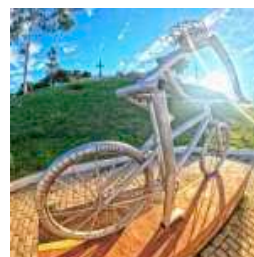
PRAÇA DO CICLISTA