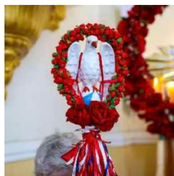
DIVINO ESPÍRITO SANTO