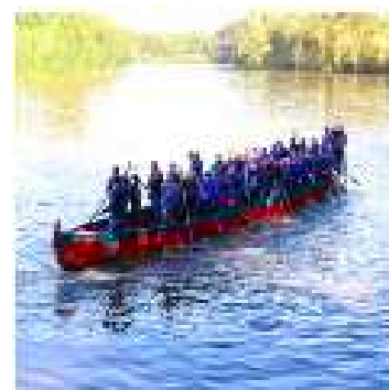
ENCONTRO DAS CANOAS