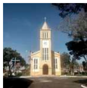
CAPELA DE SÃO SEBASTIÃO