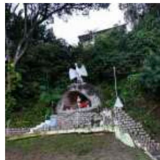
GRUTA DE SÃO SEBASTIÃO