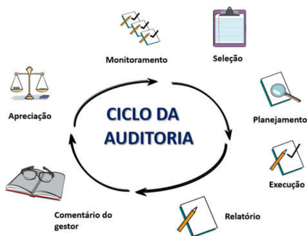
Figura 1: adaptada do TCE-PR

As ações empreendidas pela Controladoria Interna do Município respeitam fases próprias de trabalho, correspondentes a: seleção, planejamento, execução, relatório, comentário do gestor, apreciação e monitoramento.