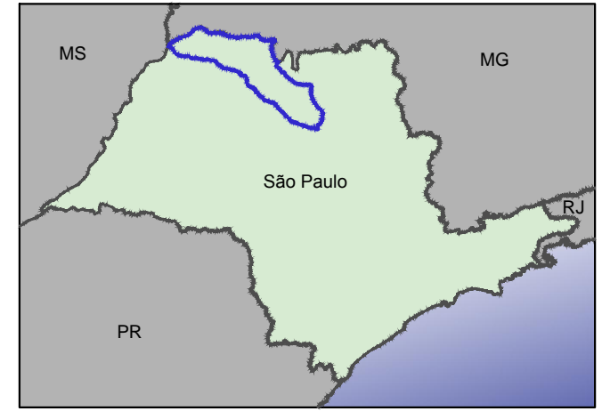
Mapa de Localização da UGRHI 15 no Estado de São Paulo