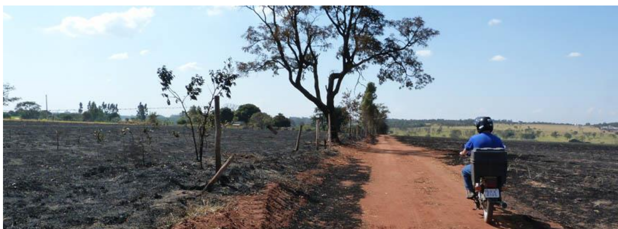
Figura: Agentes de fiscalização ambiental em vistoria