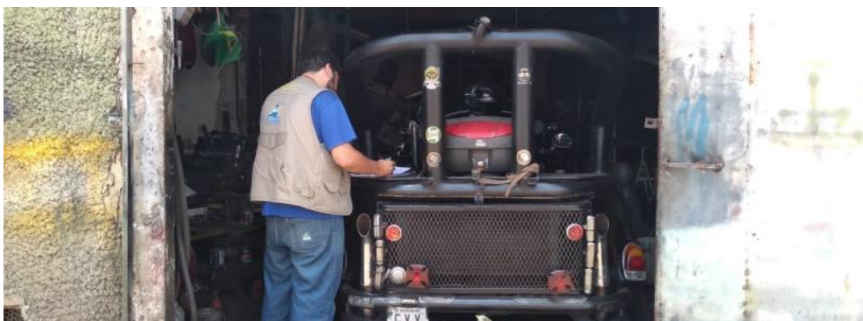
Figura: Agente de fiscalização ambiental em vistoria

Desde janeiro de 2017, conforme a Lei nº 8.868/2017, foi instituído que o Departamento Autônomo de Água e Esgotos – DAAE Araraquara – é o órgão responsável pela gestão ambiental no município e, conseqüentemente, também é quem implementa as ações de licenciamento ambiental por meio de sua Gerência de Fiscalização e Licenciamento Ambiental.