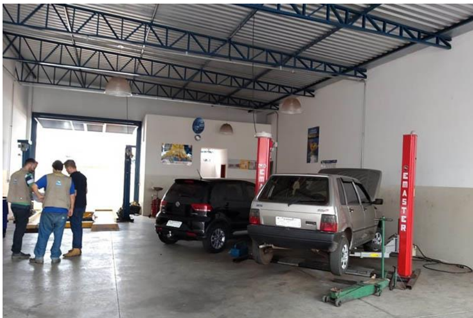
Figura: agentes de fiscalização ambiental em vistoria