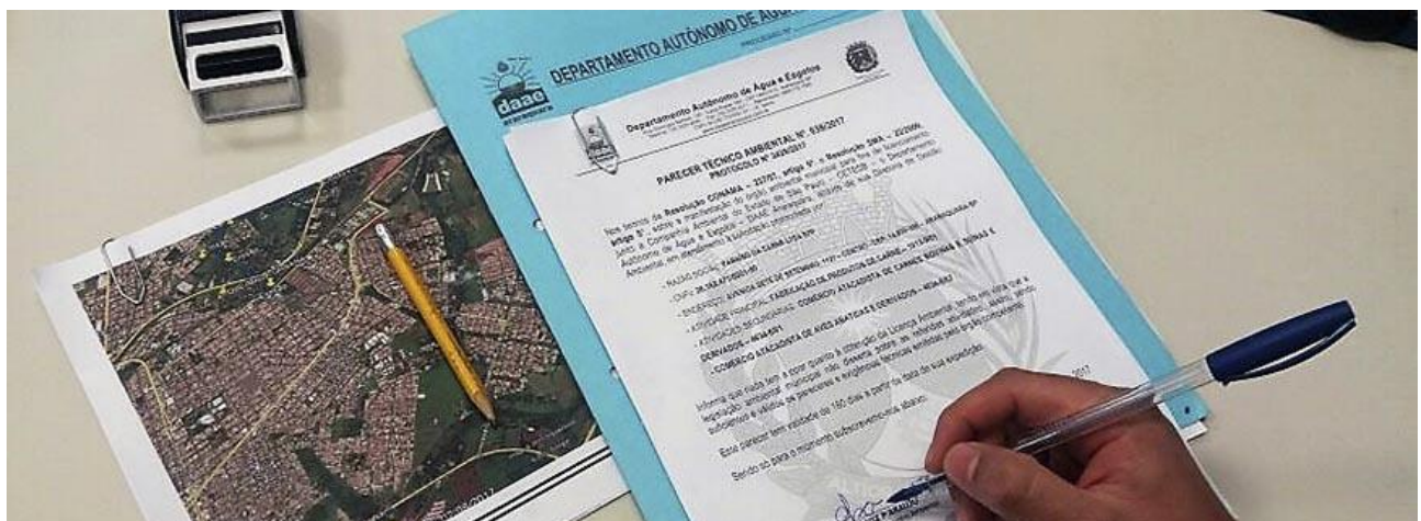
Figura: Emissão de Parecer Técnico Ambiental

Portanto, antes de iniciar a instalação de uma atividade, é importante consultar os órgãos ambientais estadual e municipal para averiguar quais serão as licenças necessárias.