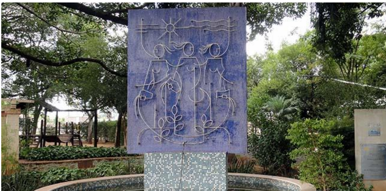
Figura: Praça do DAAE Araraquara

Rua Domingos Barbieri, 100 – Caixa Postal, 380 – CEP 14802-510 – Araraquara/ SP Telefone: (16) 3324-9934 (16) 3324-9935 – www.daaeararaquara.com.br ulra@daaeararaquara.com.br