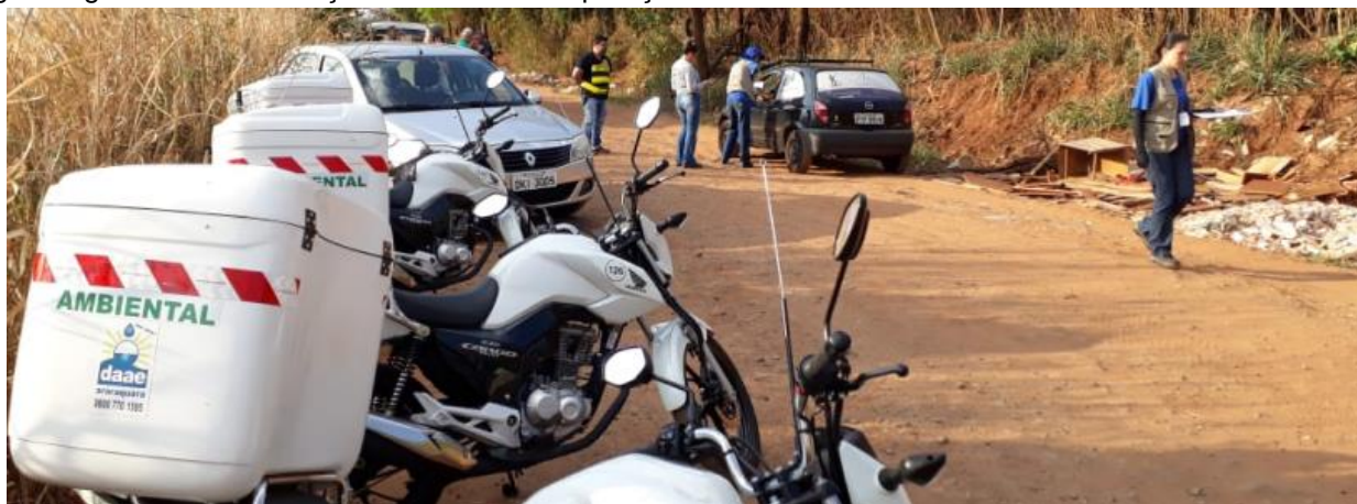
Figura: agentes de fiscalização ambiental em operação