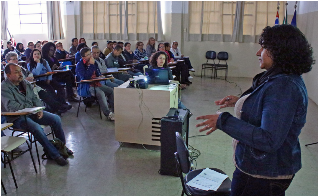
Turma do curso de “Boas Práticas na Manipulação de Alimentos em Atividades de Alto Risco”

Segundo cartilha informativa de Vigilância Sanitária publicada pelo Ministério da Saúde em 2002, no início com o nascimento das cidades ainda na Idade Antiga o conhecimento sobre o contágio de doenças e a sua prevenção eram escassos, contudo, era sabido que a água poderia ser uma via de contaminação e os alimentos um meio de propagação. Surgiu neste momento os primeiros cuidados com os problemas sanitários. O tratamento de água, o cuidado com os alimentos e uma melhor destinação do lixo foram as primeiras ações.