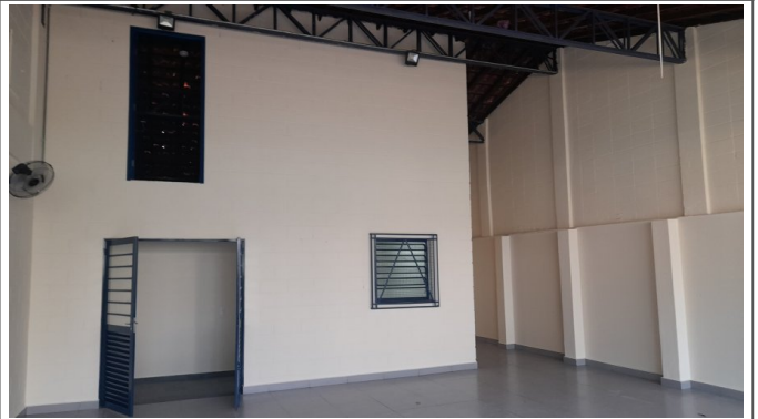
Limpeza final da obra