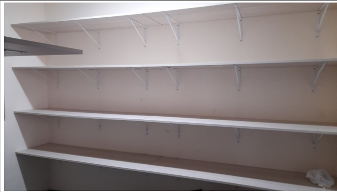
Instalação de bancada em MDF laminado