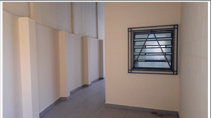
Limpeza final da obra