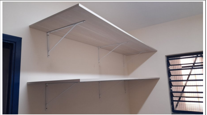
Instalação de bancada em MDF laminado