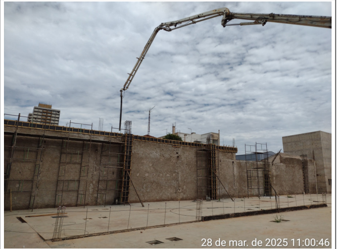
28 de mar. de 2025 11:00:46