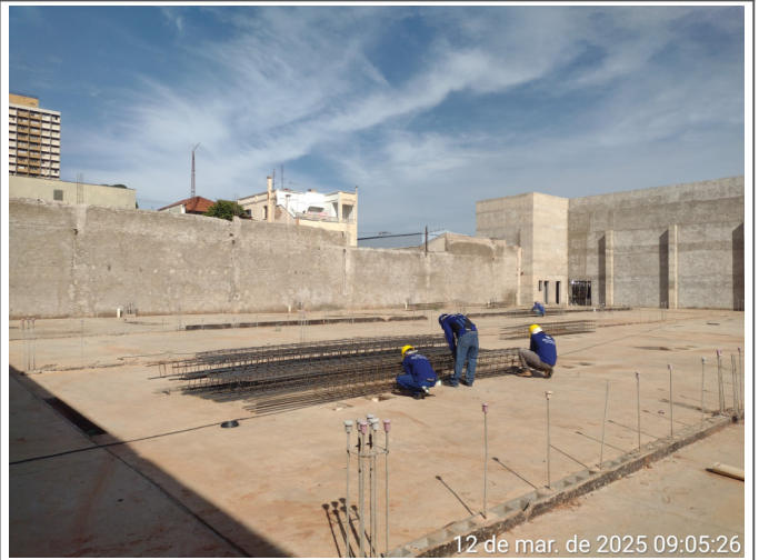
12 de mar. de 2025 09:05:26