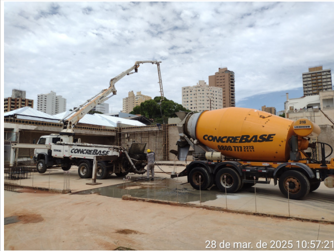
28 de mar. de 2025 10:57:21