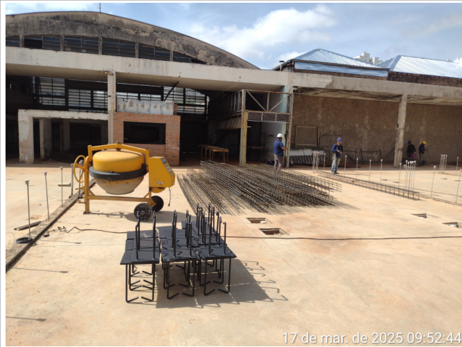
17 de mar. de 2025 09:52:44