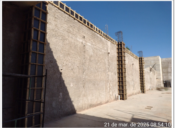
21 de mar. de 2025 08:54:10