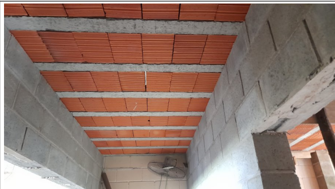
Execução de laje pre moldada da ampliação das salas