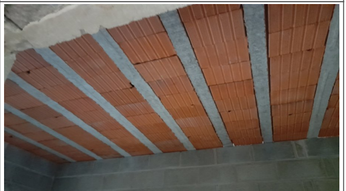
Execução de laje pre moldada da ampliação das salas