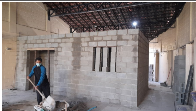
Alvenaria estrutural de bloco de concreto da ampliação das salas