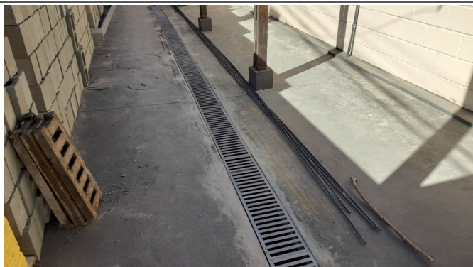
Fornecimento e colocação de grelha de ferro fundido em canaletas de águas pluviais