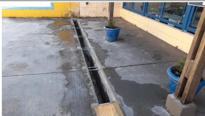
Fornecimento e colocação de grelha de ferro fundido em canaletas de águas pluviais