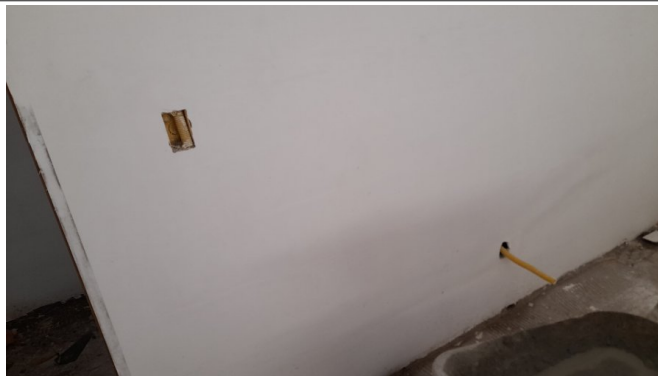
Instalações Elétricas: rasgos em alvenaria e passagem de eletrodutos corrugados