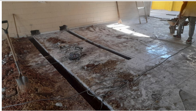
Demolições e retiradas de pisos de concreto e cerâmicos