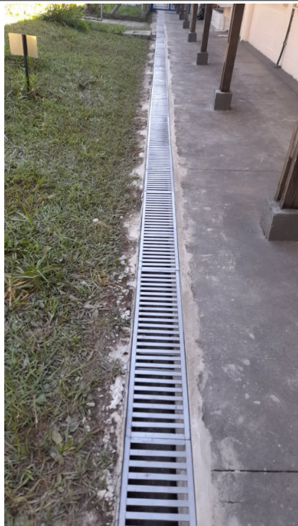
Fornecimento e colocação de grelha de ferro fundido em canaletas de águas pluviais