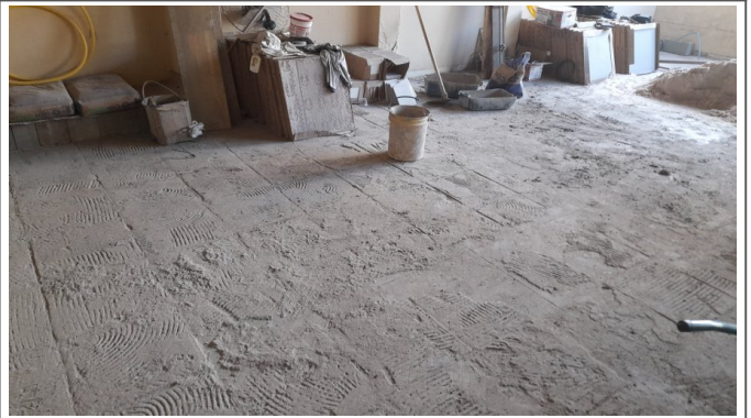
Demolições e retiradas de pisos de concreto e cerâmicos