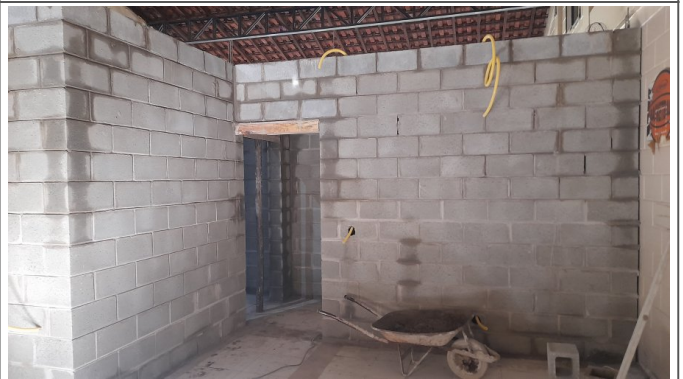
Alvenaria estrutural de bloco de concreto da ampliação das salas