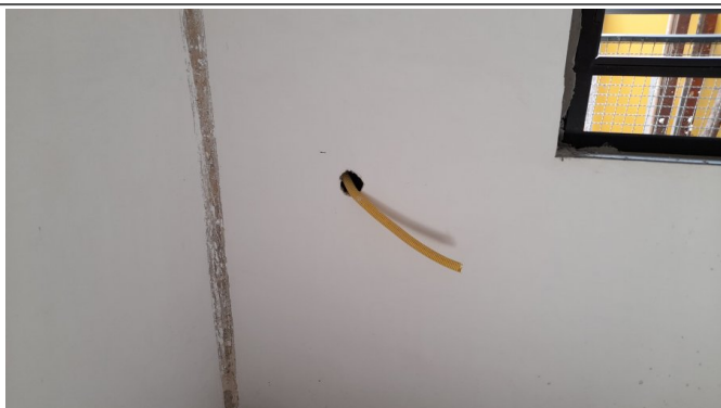
Instalações Elétricas: rasgos em alvenaria e passagem de eletrodutos corrugados