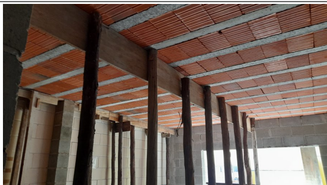
Execução de laje pre moldada da ampliação das salas