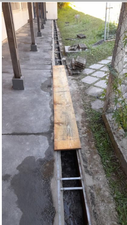
Fornecimento e colocação de grelha de ferro fundido em canaletas de águas pluviais