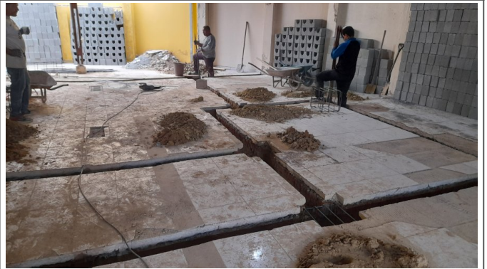
Execução da fundação da ampliação das salas