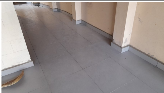
Assentamento de revestimento em paredes e piso