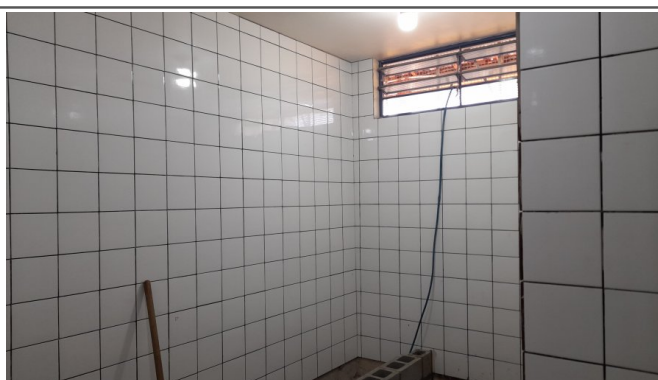
Assentamento de revestimento em paredes e piso