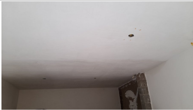
Revestimento de paredes e tetos em gesso liso