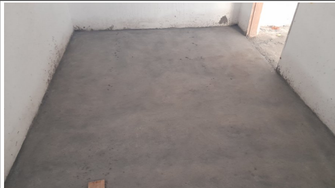
Regularização de piso de concreto