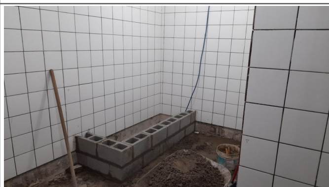
Assentamento de revestimento em paredes e piso e Instalações hidrossanitárias