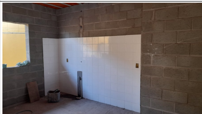
Assentamento de revestimento em paredes e piso e Instalações hidrossanitárias