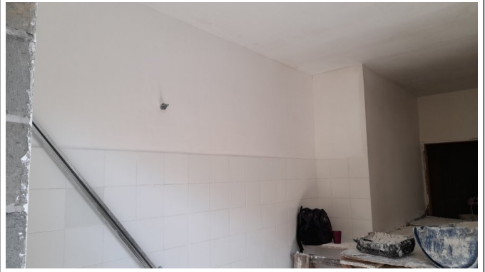
Revestimento de paredes e tetos em gesso liso