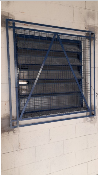
Fornecimento e instalação de esquadrias e grades de proteção em ferro