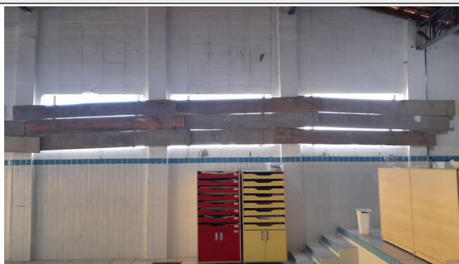
Demolições e retiradas