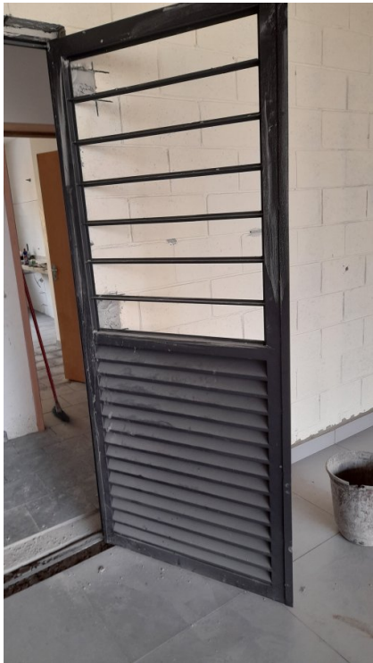
Fornecimento e instalação de esquadrias e grades de proteção em ferro