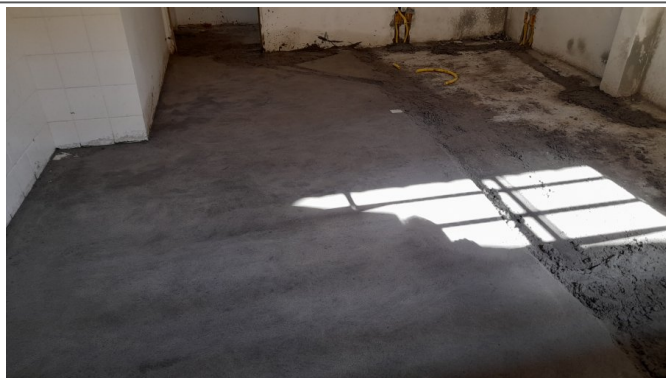
Regularização de piso de concreto