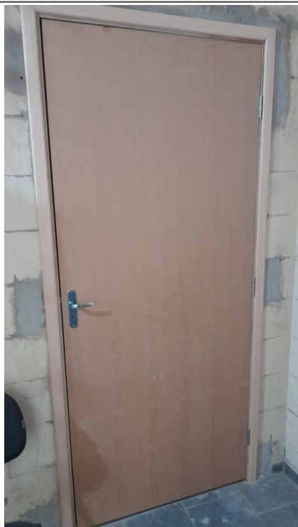
Assentamento de batentes e portas de madeira