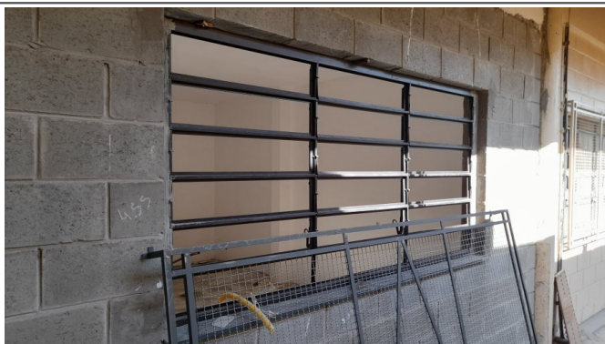
Fornecimento e instalação de esquadrias e grades de proteção em ferro