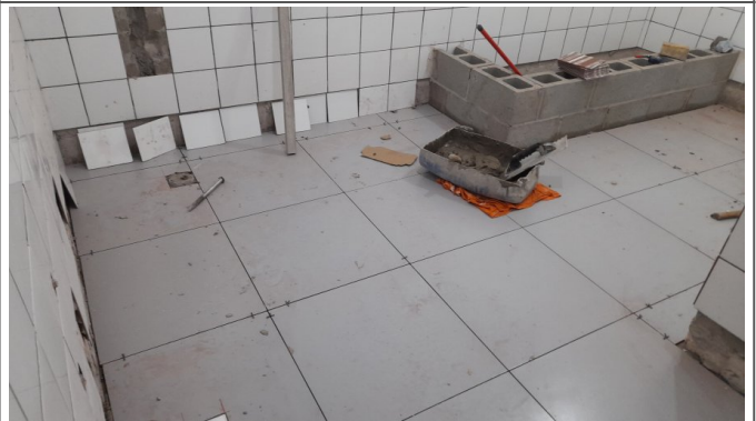
Assentamento de revestimento em paredes e piso