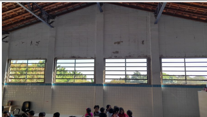
Fornecimento e instalação de esquadrias e grades de proteção em ferro