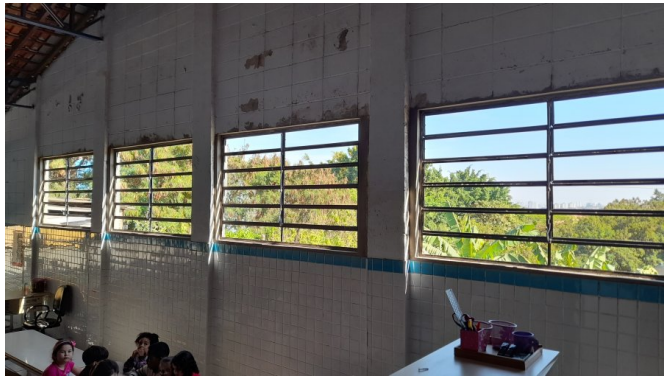
Fornecimento e instalação de esquadrias e grades de proteção em ferro