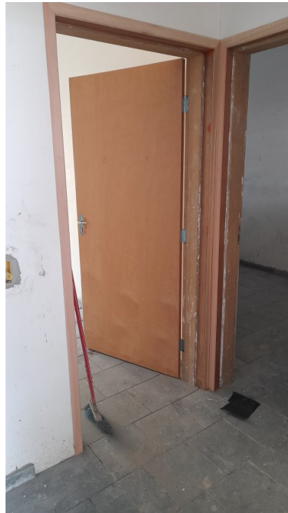
Assentamento de batentes e portas de madeira