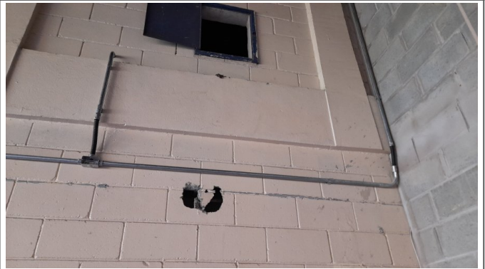
Instalações elétricas: fiação