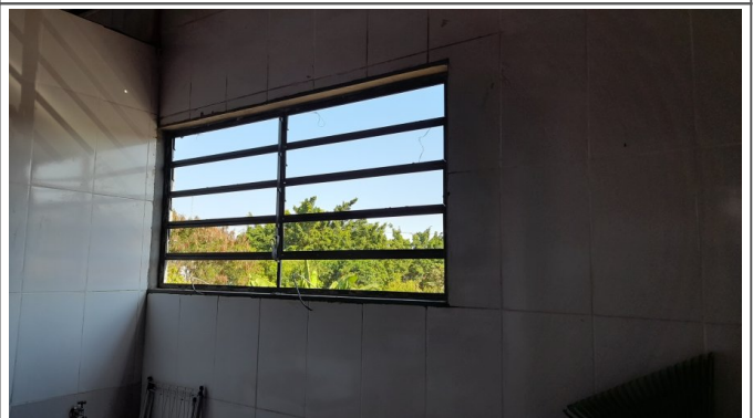
Fornecimento e instalação de esquadrias e grades de proteção em ferro