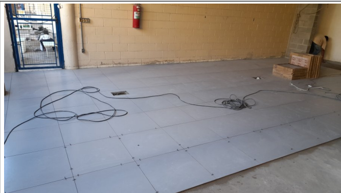
Assentamento de revestimento em paredes e piso