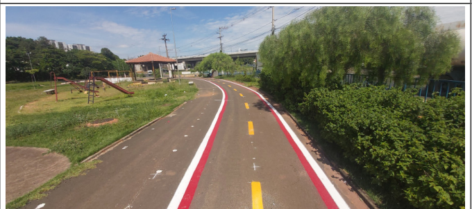
Execução de pintura da ciclofaixa.