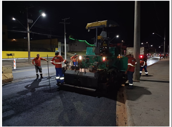
Execução de Camada de CBUQ.