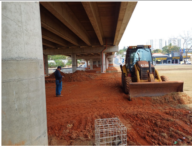
Remoção de Camada Vegetal sob o Viaduto Mons. Gustavo Mantovani