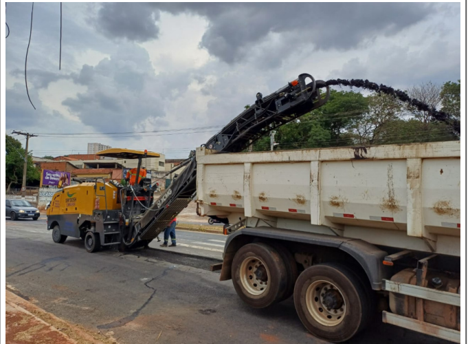
Execução de Fresagem do Asfalto.