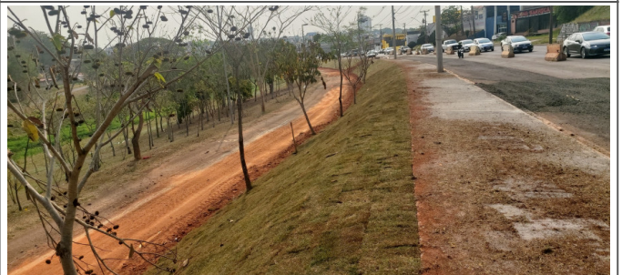
Plantio de Grama em Talude.