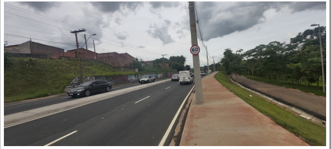
Execução de sinalização de trânsito