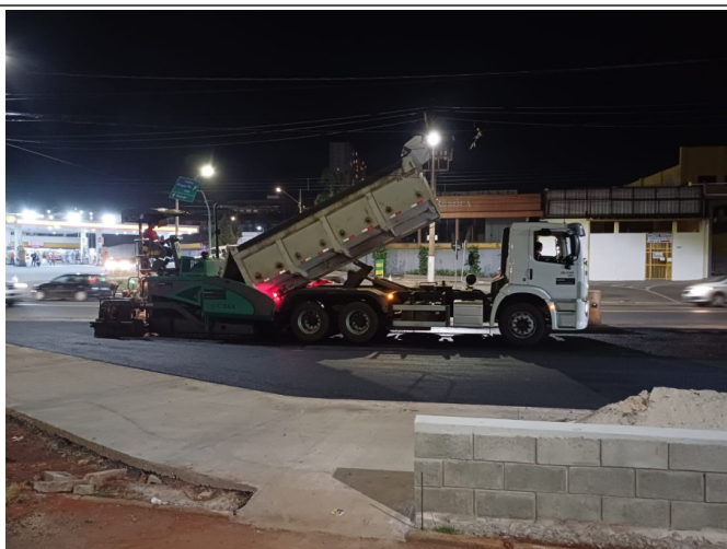
Execução de Camada de CBUQ.