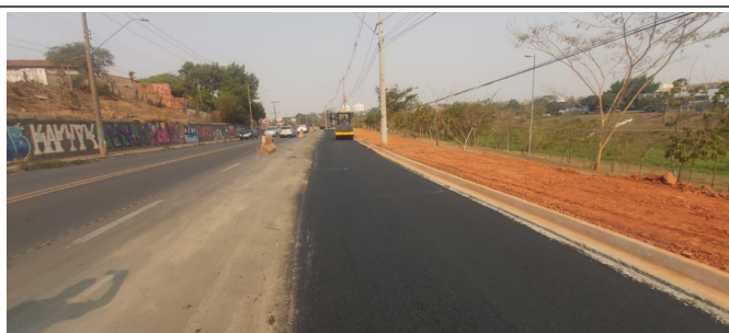
Execução de camada de Binder.