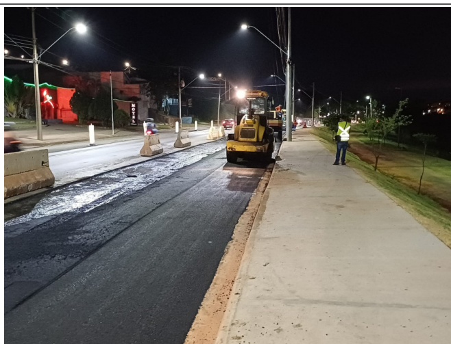
Execução de Camada de CBUQ.