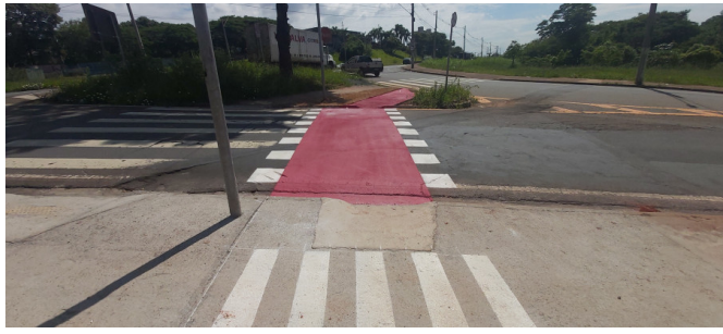
Execução de pintura da ciclofaixa.