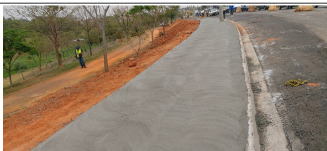
Execução de Calçada.