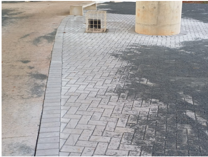
Execução de Piso com Bloco Intertravado sob o Viaduto Mons. Gustavo Mantovani.