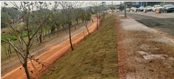
Plantio de Grama em Talude.