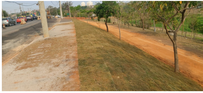
Plantio de Grama em Talude.