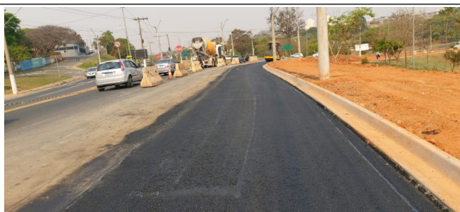
Execução de camada de Binder.