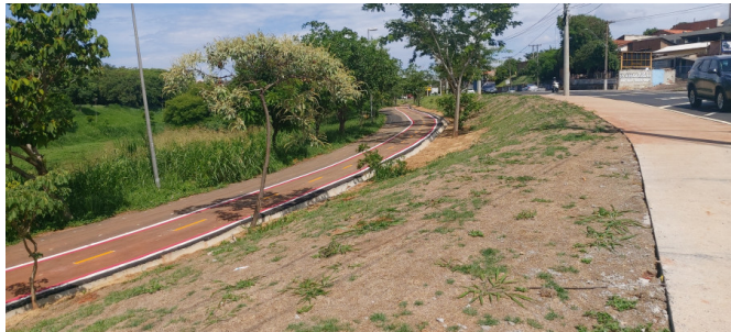
Execução de pintura da ciclofaixa.