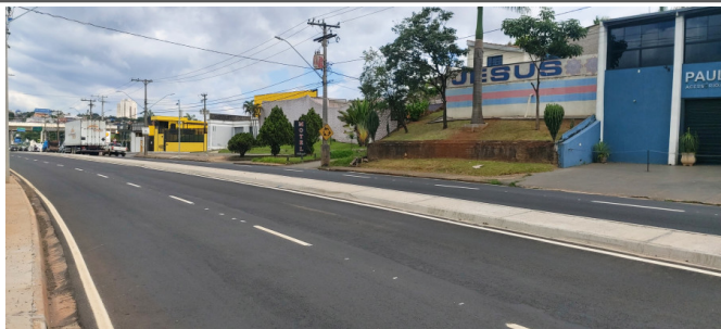
Execução de sinalização de trânsito