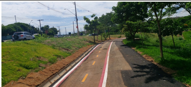
Execução de pintura da ciclofaixa.