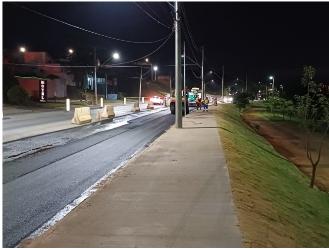
Execução de Camada de CBUQ.