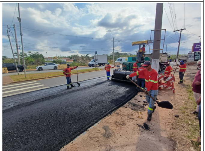
Execução de Camada de CBUQ.