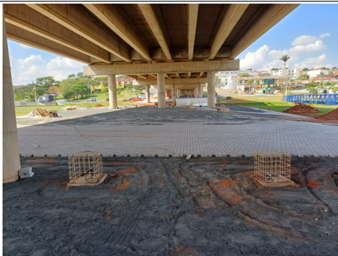
Execução de Piso com Bloco Intertravado sob o Viaduto Mons. Gustavo Mantovani.