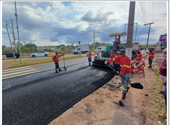
Execução de Camada de CBUQ.