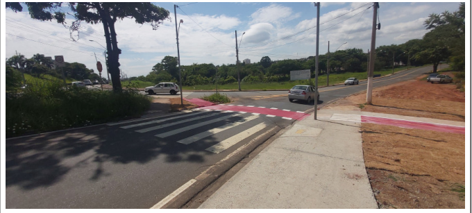
Execução de pintura da ciclofaixa.