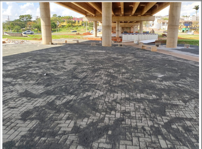
Execução de Piso com Bloco Intertravado sob o Viaduto Mons. Gustavo Mantovani.