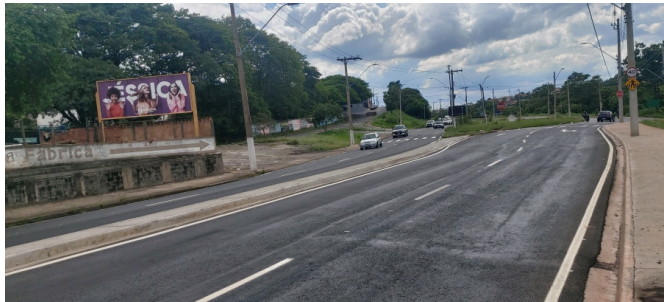
Execução de sinalização de trânsito