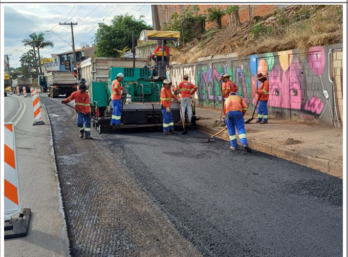
Execução de Camada de CBUQ.