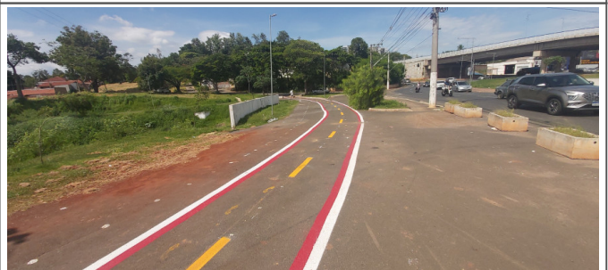
Execução de pintura da ciclofaixa.