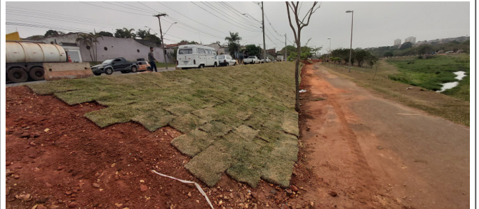
Plantio de Grama em Talude.