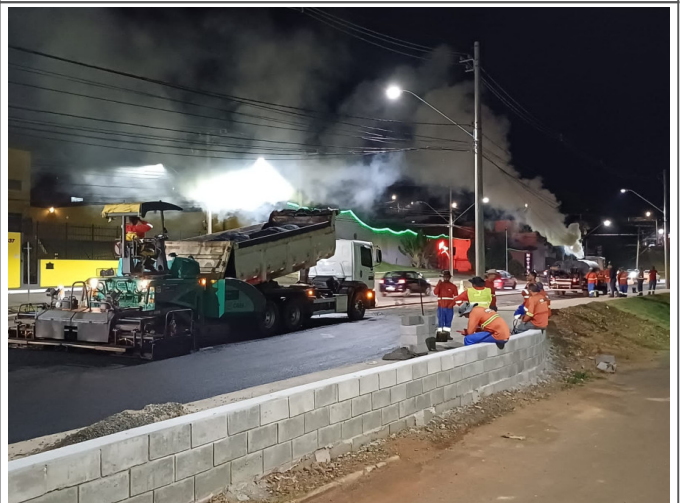
Execução de Camada de CBUQ.