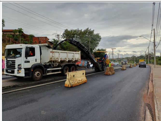
Execução de Camada de CBUQ.