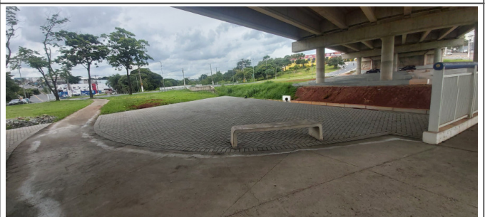
Execução de Piso com Bloco Intertravado sob o Viaduto Mons. Gustavo Mantovani.