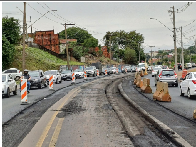
Execução de Camada de CBUQ.