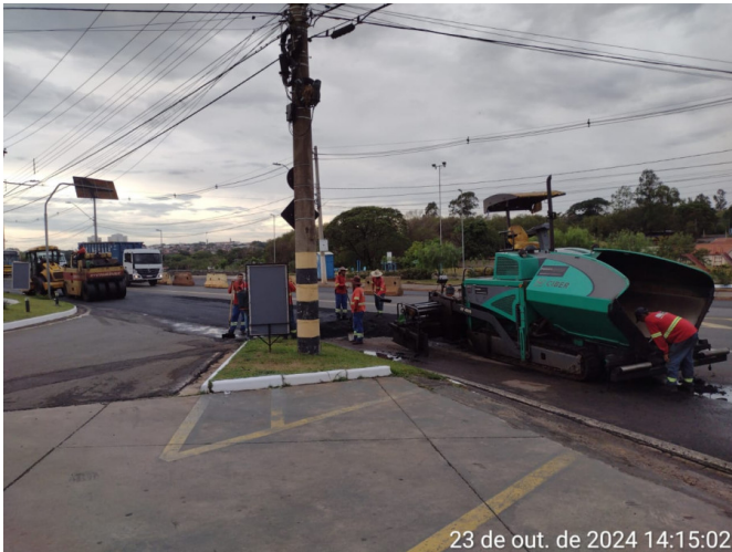
Execução de Camada de CBUQ.