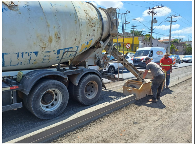
Execução de Guia e Sarjeta em Canteiro Central.