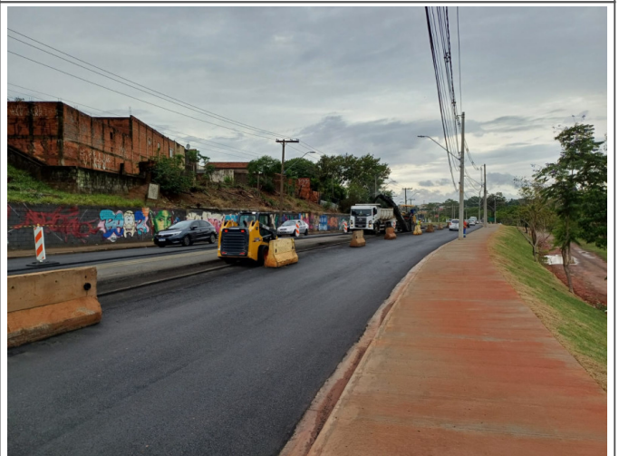
Execução de Camada de CBUQ.