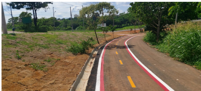
Execução de pintura da ciclofaixa.