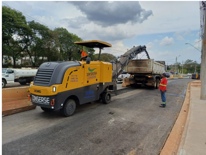
Execução de Fresagem do Asfalto.