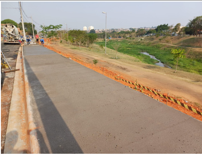
Execução de Calçada.