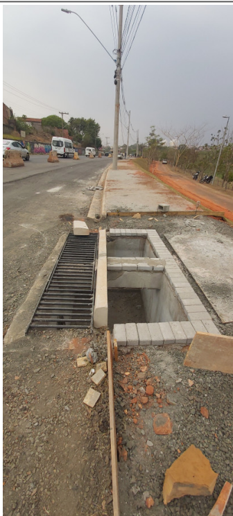
Execução de BL Mista (Boca de Leão e Boca de Lobo)