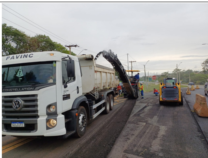
Execução de Fresagem do Asfalto.