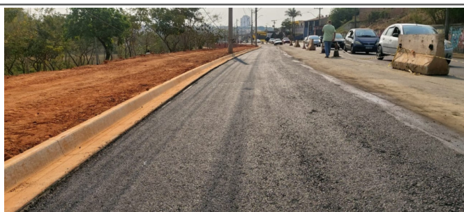
Execução de camada de Binder.