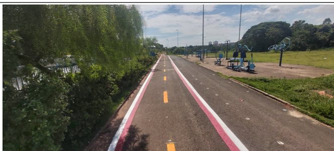
Execução de pintura da ciclofaixa.