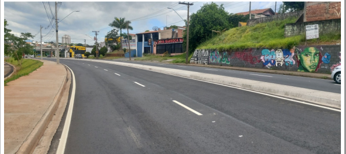
Execução de sinalização de trânsito