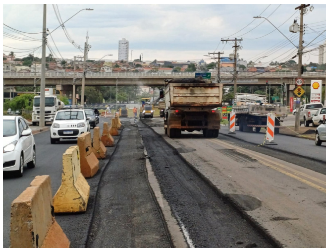
Execução de Fresagem do Asfalto.