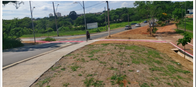
Execução de pintura da ciclofaixa.