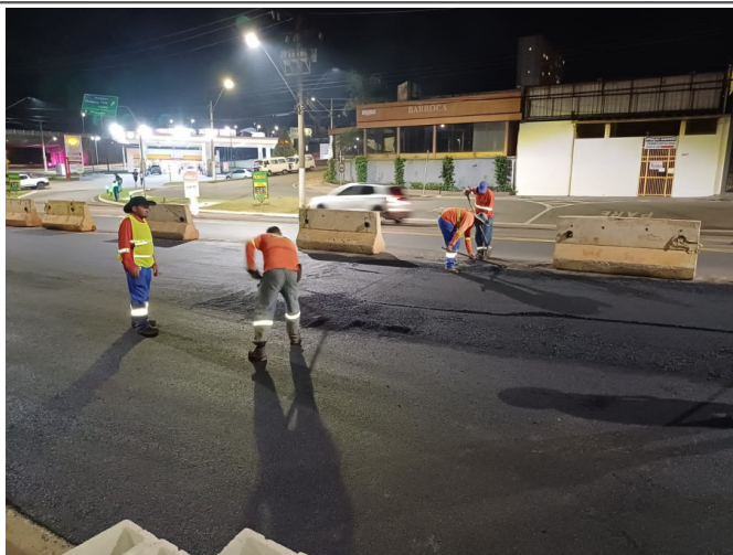
Execução de Camada de CBUQ.