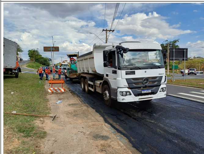
Execução de Camada de CBUQ.