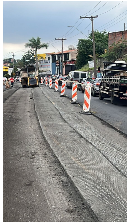
Execução de Fresagem do Asfalto.