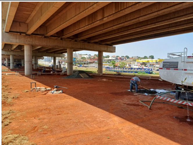
Preparação do solo para execução do piso com bloco intertravado