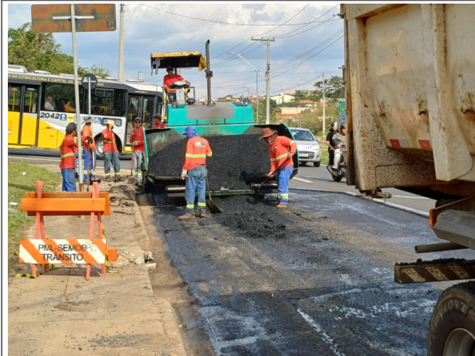
Execução de Camada de CBUQ.