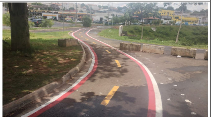
Execução de pintura da ciclofaixa.