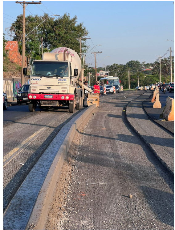
Execução de Guia e Sarjeta em Canteiro Central.