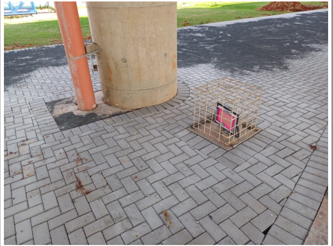
Execução de Piso com Bloco Intertravado sob o Viaduto Mons. Gustavo Mantovani.