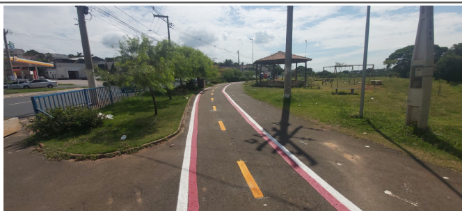
Execução de pintura da ciclofaixa.