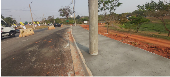
Execução de Calçada.