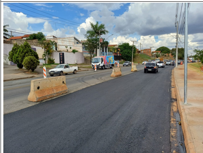
Execução de Camada de CBUQ.