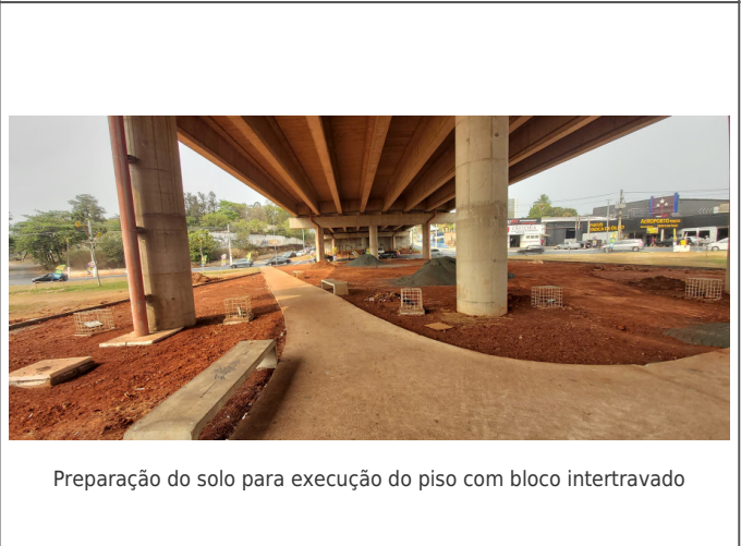
Preparação do solo para execução do piso com bloco intertravado