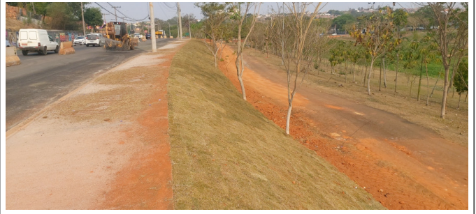
Plantio de Grama em Talude.