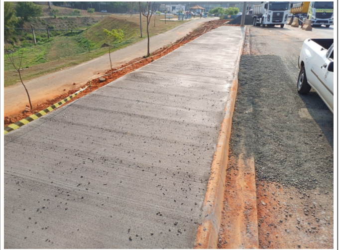
Execução de Calçada.