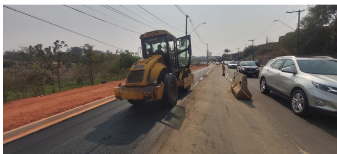
Execução de camada de Binder.