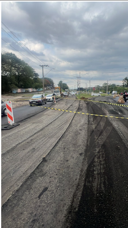
Execução de Fresagem do Asfalto.