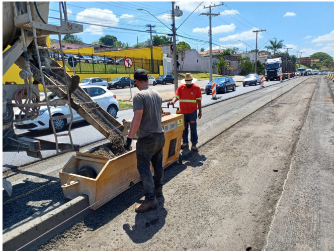
Execução de Guia e Sarjeta em Canteiro Central.