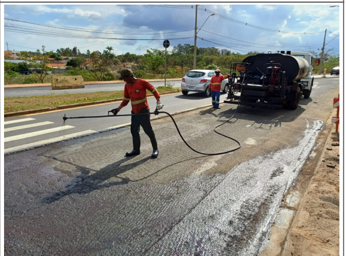
Execução de Camada de CBUQ.