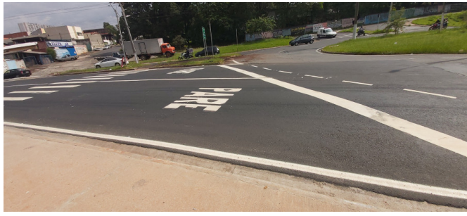
Execução de sinalização de trânsito