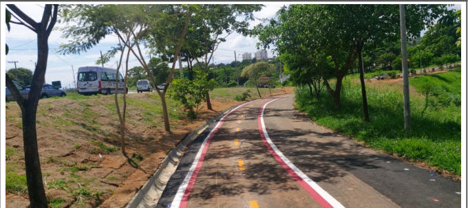
Execução de pintura da ciclofaixa.