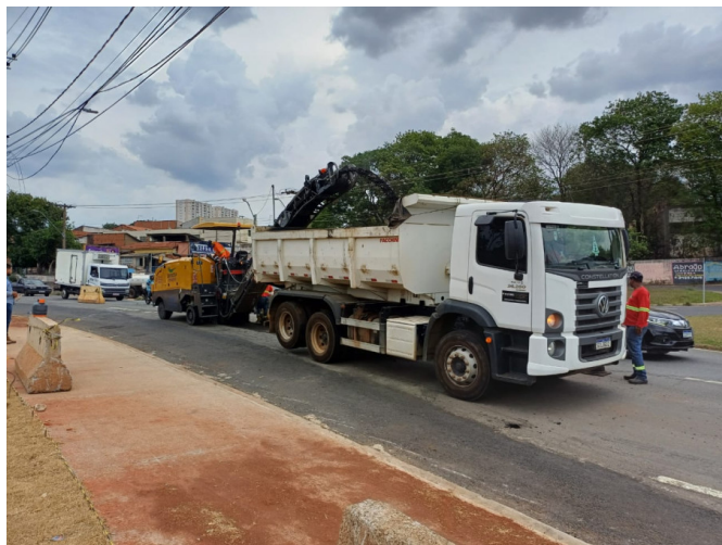
Execução de Fresagem do Asfalto.