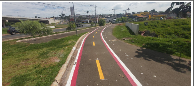
Execução de pintura da ciclofaixa.