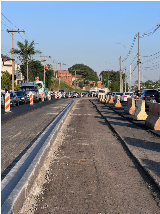
Execução de Guia e Sarjeta em Canteiro Central.