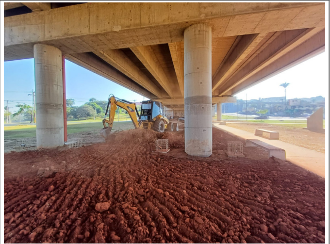
Remoção de Camada Vegetal sob o Viaduto Mons. Gustavo Mantovani