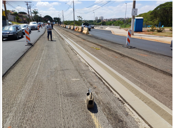
Execução de Guia e Sarjeta em Canteiro Central.