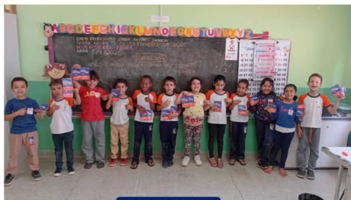
XERIFES DA DENGUE