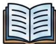
Feira do Livro