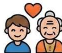
Dia das Crianças/Idoso