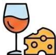
Festival Queijo e Vinho