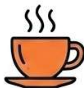
Agro Festival Best Coffee