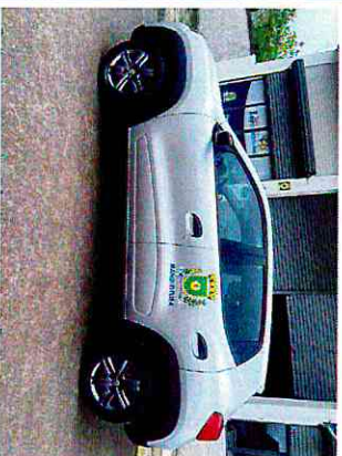
FOTO LATERAL DIREITA/ESQUERDA

Observações: Chassi 93YRBB009P1305742_REN