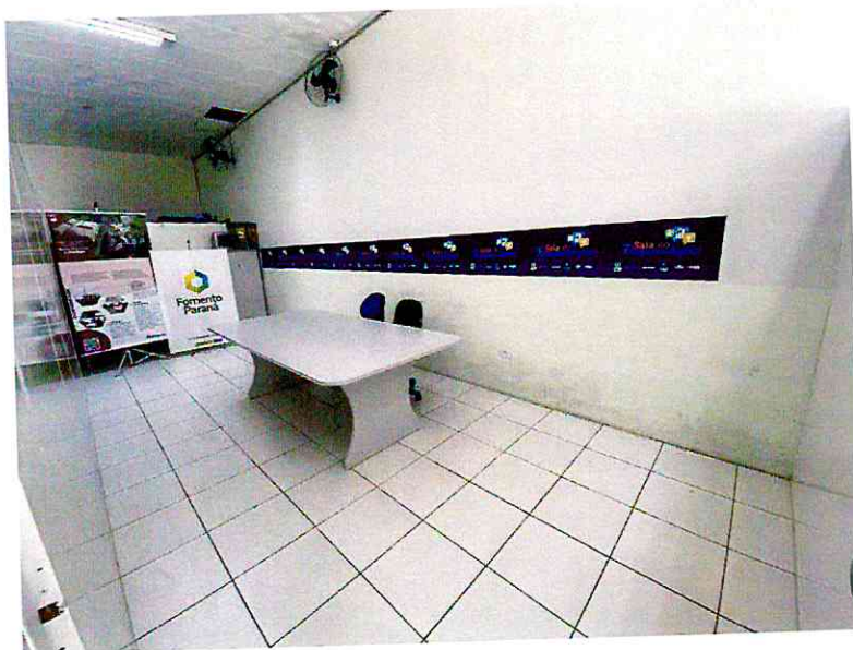
SALA DE REUNIÃO