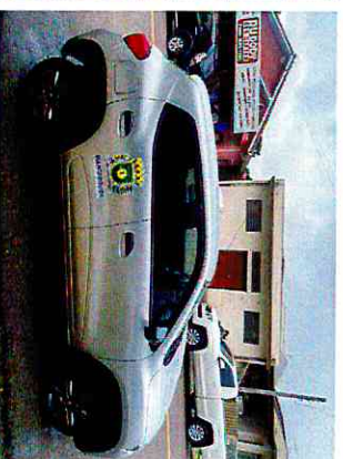
FOTO FRONTAL/ TRASEIRA