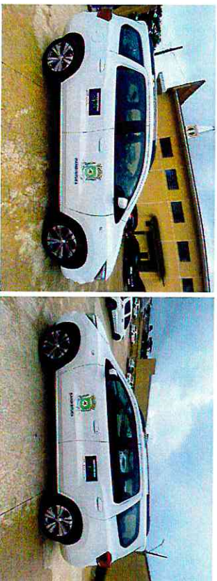
FOTO FRONTAL/ TRASEIRA