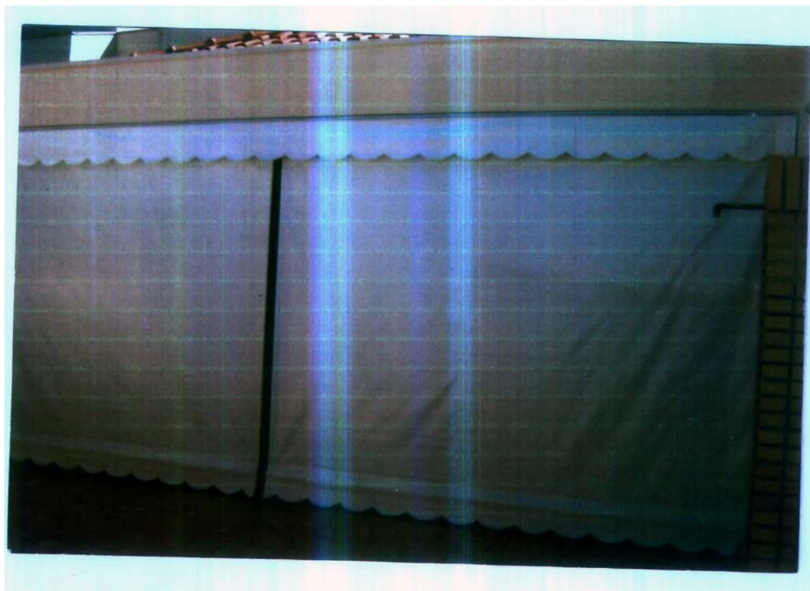
TOLDO RETANGULAR FIXO