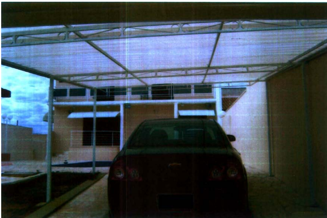
COBERTURA TIPO TÚNEL – FIBRA DE VIDRO